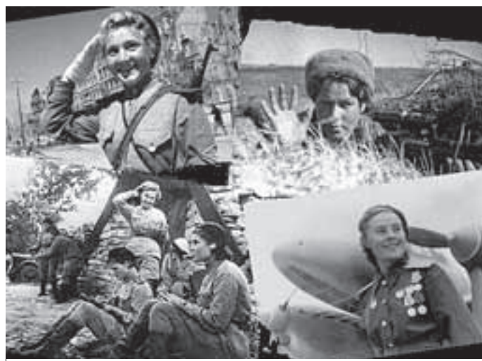
Женщины служили в разных войсках

В первых числах января приступили к плановым занятиям, каждый день – 8 часов занятий и 2 часа самоподготовки. Срок учёбы – 10 месяцев. Занятия по строевой, физической, огневой подготовке проводили командиры взводов. Занятия по специальной подготовке проводили преподаватели в классах и в полевых условиях, как днём, так и ночью. Были занятия по топографии, ориентированию на местности, фортификации, строительству деревянных мостов и прочее. Особое внимание уделялось подрывному делу, установке фугасов, противотанковых заграждений, а также минированию и разминированию перед передним краем обороны, изучению минно-взрывных средств армии противника. Курсантки к освоению преподаваемых предметов от-