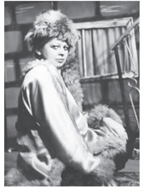
Лиса Алиса из спектакля «Буратино»

— Ксанчик! — слышу я за своей спиной знакомый игривый голосок, оборачиваюсь и улыбаюсь встрече.