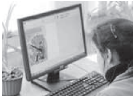
Творить помогает компьютерная графика

П ожалуй, никому в Юбилейном не надо объяснять, что такое «УЛИТка». Несколько месяцев самые верные поклонники новейших компьютерных технологий всех школ города готовятся к традиционному конкурсу, проводимому городским методическим объединением учителей информатики и гимназией № 5 при поддержке Администрации города и Российской научно-социальной программой для молодёжи и школьников «Шаг в будущее, Москва» МГТУ им. Н.Э. Баумана.