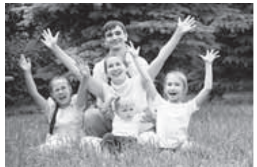
Всем многодетным семьям — земельные участки

ских странах есть закон — ребёнок не может пойти в школу, если последний год-два перед ней не посещал детский сад. Потому что серьёзной предшкольной подготовки у него в данном случае нет, он хуже адаптируется в коллективе, хуже учится. Вот к такому подходу к дошкольному образованию нам надо стремиться,