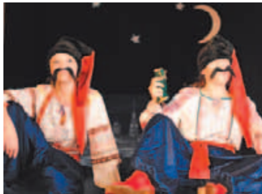
Сцена из спектакля «Ночь перед Рождеством»

— Мы ездим и на гастроли, и на фестивали. Фестивали проходят в Москве, Чехове, Жуковском, Коломне. А вот гастроли зарубежные. За последние пять лет мы четыре раза съездили в Данию и Германию. С 2010 года