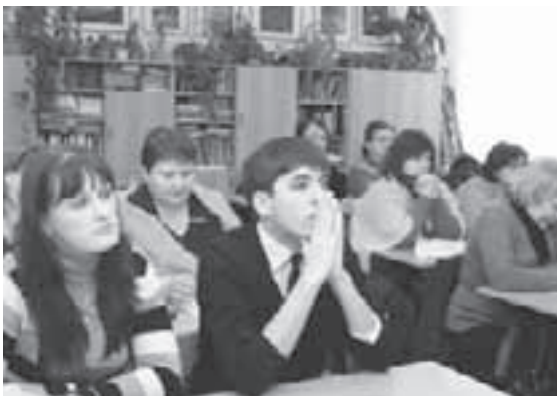
Участники методического семинара

Материалы подготовила Елена МОТОВА