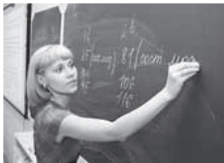
Учителя должны получать достойную зарплату

Только в прошлом году было открыто 16 тысяч новых мест в детских дошкольных учреждениях — это абсолютный рекорд, в Московской области никогда такого не было. 27 садов-новостроек, 18 возвращённых в систему дошкольного образования учреждений. Почти 9 тысяч мест дало рациональное использование площадей, когда в уже действующих детсадах появлялись пристройки или теснились всяческие сопутствующие дошкольному образованию службы. Практически всё делалось за счёт бюджетных средств — 1 миллиард рублей выделили из областного бюджета, 842 миллиона потратили муниципальные образования, 8,2 миллиона рублей дал федеральный бюджет. Виктор Егоров показывает список муниципальных образований, где напротив некоторых городов и районов стоят радующие глаз нули — это зна-