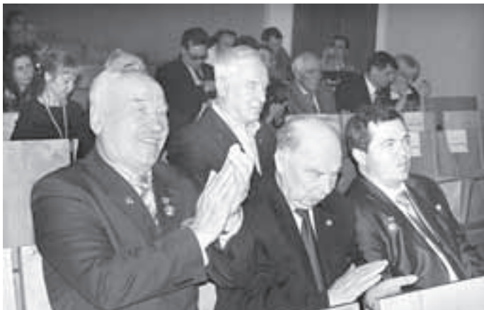
Ветераны космоса и гости праздничного вечера

Ведущий праздника А.И. Чекунов представил гостя – лётчика-космонавта Героя России Олега Викторовича Скрипочку, который работал на Международной космической станции более полугода – с 8 октября 2010 года по 16 марта 2011 года. Несмотря на такое нелёгкое испытание, Олег Викторович выглядит бодро и готов к более длительным полётам.