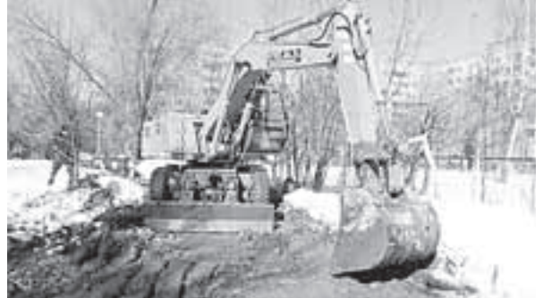
Аварию устранили оперативно

Специалисты оперативно обнаружили и устранили течь, наложив хомут. Выяснилось, что вместе с порывом водоподающей трубы треснула и канализационная, ведущая к другому колодцу. Около 6 метров трубы пришлось заменить.