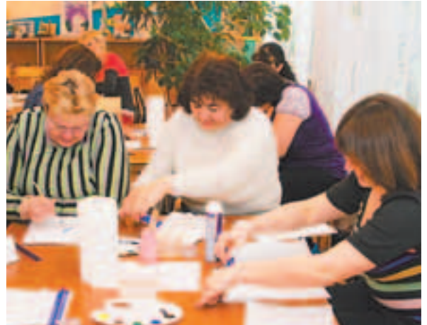
Главное не пена, а творчество

ство из них она использует на занятиях в своей группе (конечно, в зависимости от возраста детей). Но столь быстрым («картина» создаётся менее чем за 10 минут) и в то же время уникальным способом создания изображения были изумлены все участники мастер-класса.