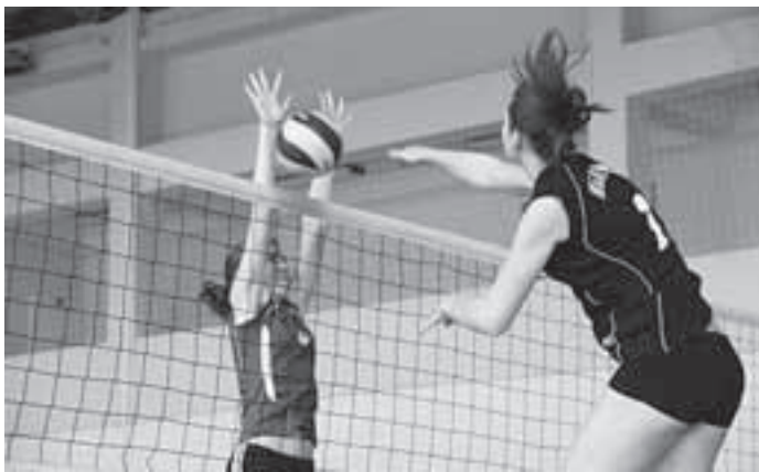
Напряжённость борьбы чувствуется в каждом движении

Анастасия РОМАНОВА, фото из архива ДЮСША