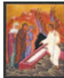
Страницу подготовила Марина ЖУРБЕНКО

Православная Церковь отмечает этот день как праздник всех женщин-христианок, отмечает их особую роль в семье и обществе, укрепляет их в их самоотверженном подвиге любви и служения ближним.