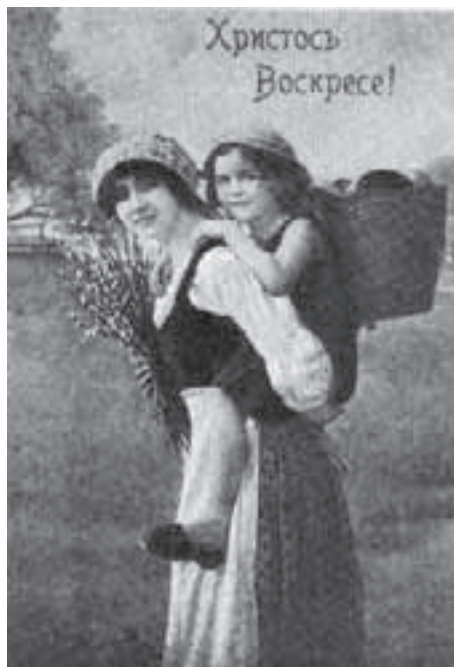
Одна из пасхальных открыток, представленных на выставке