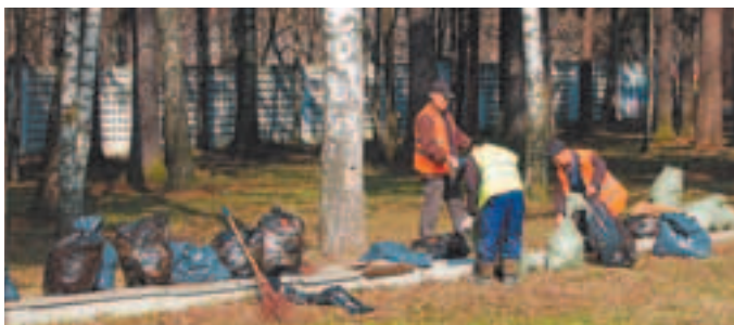
Уборка в районе озера в 1-м мкр.