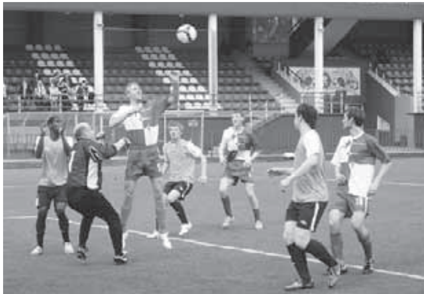
Один из напряжённых моментов матча