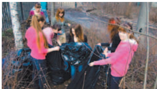
Ученики гимназии № 5 тоже принимали участие в общегородском субботнике