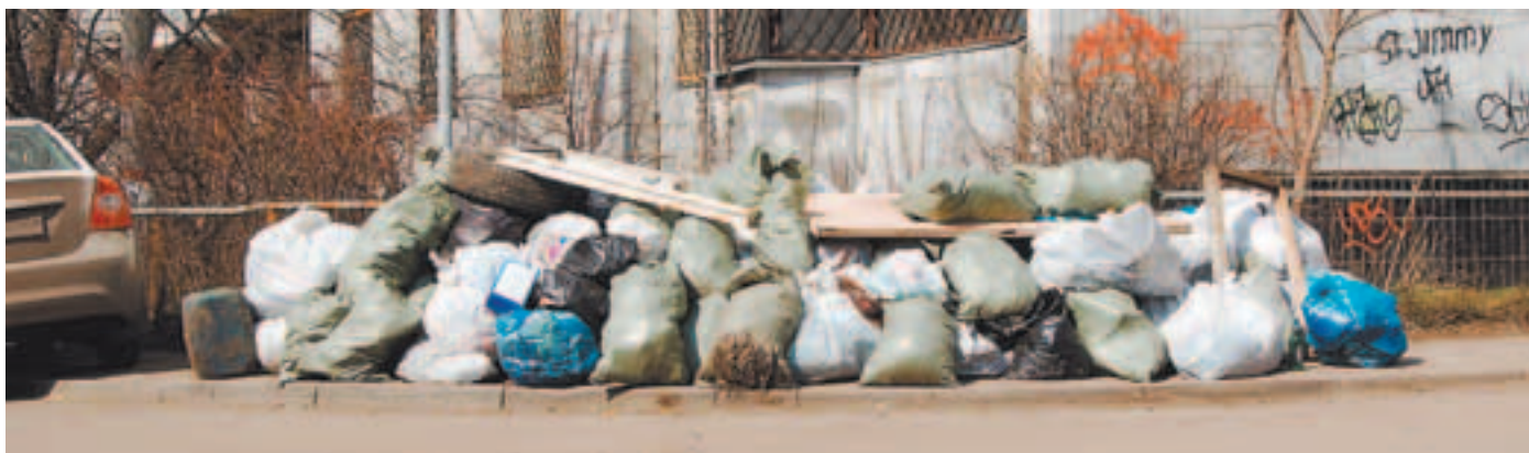
Мусор скоро будет вывезен...