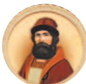
Великий князь Константин Всеволодович (1186—1218) Годы правления: 1216—1218

После кончины Всеволода Северная Русь стала распадаться на отдельные княжества, но всё же сохранялись единый язык и христианская вера.