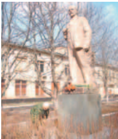
Коммунисты города не забыли своего вождя