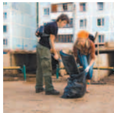
Жители дома № 15 по ул. Пушкинской убирали придомовую территорию