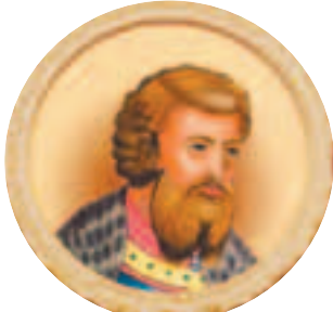
Великий князь Всеволод III Юрьевич Большое Гнездо (1154—1212) Годы правления: 1176—1212

Р ядом с великим князем Михаилом Юрьевичем всё время правления был его брат, самый младший сын Юрия Долгорукого Всеволод.