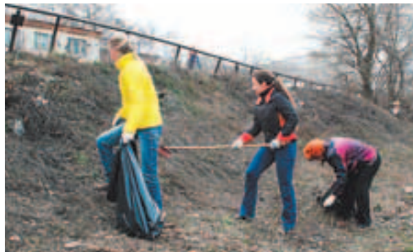
Сотрудники газеты «Спутник» убирали территорию около редакции