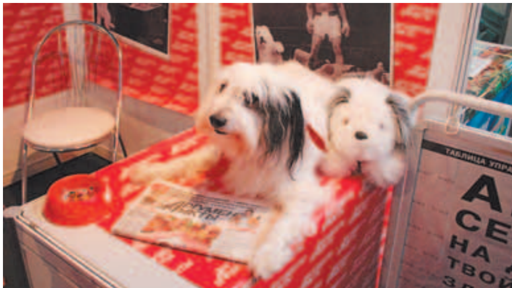
Стенд газеты «Аргументы и факты»

В рамках культурной программы нам удалось посетить старинные замки. Сначала мы отправились в национальный историко-культурный музей-заповедник «Несвиж», где посетили дворцово-замковый комплекс, когда-