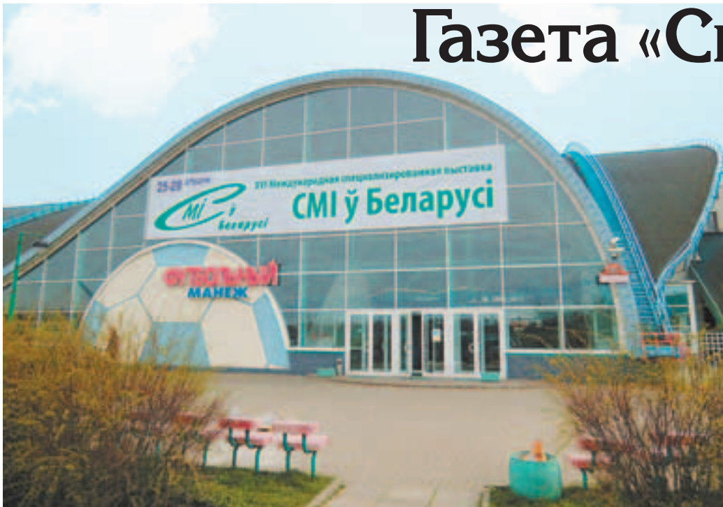
Здание футбольного манежа в Минске

В конце апреля в составе делегации Министерства по делам печати и информации Московской области я приняла участие в XVI Международной специализированной выставке «СМИ у Беларусі», которая в этом году проводилась совместно с XIX Международным форумом по телекоммуникациям, информационным и банкоматным технологиям «ТИБО-2012» в здании футбольного манежа в Минске.