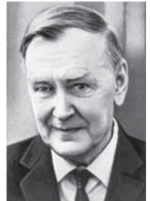
М.К. Тихонравов – советский инженер, конструктор космической и ракетной техники, доктор технических наук, профессор, лауреат Ленинской премии, Герой Социалистического Труда, Заслуженный деятель науки и техники РСФСР

Нам удалось сохранить и многие из росших в те времена деревьев, хотя это было нелегко: у башенного крана стрела – 25 метров. Тем не менее, сосны и лиственные деревья вдоль улицы, лес на технической территории нам удалось сберечь. Горожане помнят огромную красоту-ель, которую многие годы наряжали в новогодние празд-