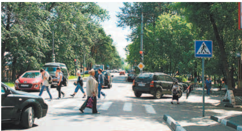
По значимости, потоку машин и пешеходов улице М.К. Тихонравова нет равных в городе