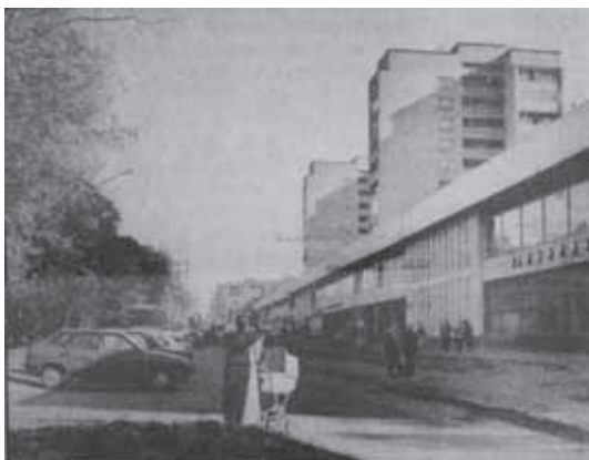
Улица М.К. Тихонравова десятилетия назад