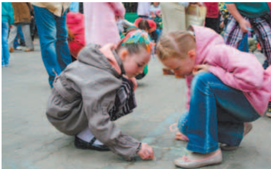
Конкурс рисунков на асфальте