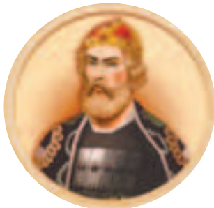
Великий князь Михаил Ярославич Святый (1271–1318) Годы правления: 1304–1318

П осле кончины Андрея Александровича на престол великого князя претендовали Михаил Тверской и Юрий Данилович Московский. Князь Михаил имел больше прав, так как на тот момент был старейшим из рода. Юрий приходился ему племянником. Право Михаила казалось всем неоспоримым: большие бояре великого князя поспешили поздравить его сразу после погребения Андрея.