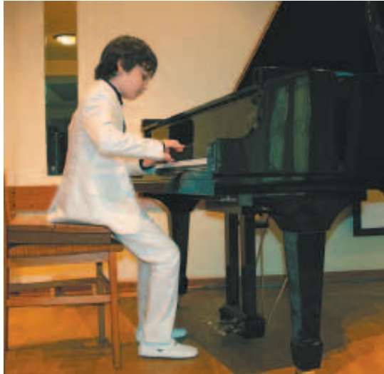
Уроля Ильи Апакия

Более сорока юных музыкантов в трёх возрастных категориях (младшая – до 9 лет, средняя – до 12-ти, старшая