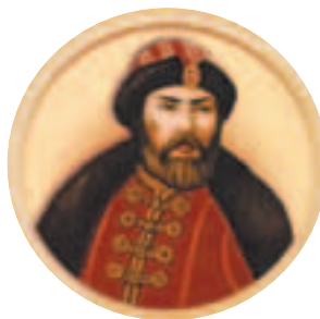
Великий князь Юрий III Данилович (1281–1325) Годы правления: 1318–1322

Православная церковь причислила Михаила к лику святых.