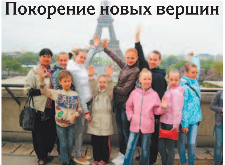
«Фантазия» в Париже

В мае, на VII Международном конкурсе в Париже «Русские сезоны – Хрустальная пирамида» Детским хореографическим ансамблем «Фантазия» Детской школы искусств завоёваны самые высокие награды в номинации «Эстрадная хореография».