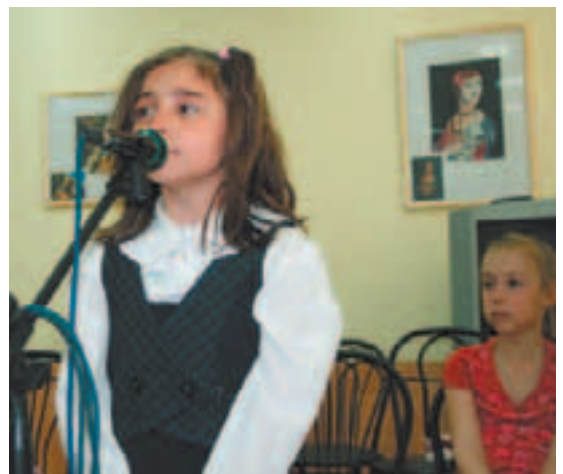
Чтобы научиться петь, надо много потрудиться