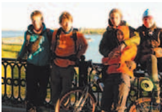
Короткая остановка в пути

Рано утром в 05.46 со станции Болшево (Фрязинского направления) мы отправились в Мытищи, там пересадка на электричку до Бужаниново в 06.23, и спустя час с небольшим мы на месте. Собираем велосипеды и выезжаем. Тут же начинается дождь, немного переждав пока он стихнет под крышей бензоколонки, мы снова сеем железных коней и отправляемся в путь. Обочина была весьма широкой в начале пути, а дорога ровной. Но неудобство доставляли фуры, пролетающие мимо нас, дождь то начинался, то заканчивался. Тем не менее, желание своими силами преодолеть столь большое расстояние заставляло двигаться дальше. Спустя 40 километров мы сделали первый привал, чтобы утеплиться. Остановились возле магазина, закупились в нём пакетами и тёплыми носками, чтоб ноги не мокли. До Переславля осталось всего 18 километров. На месте мы были в 12.30, город встретил нас хорошей солнечной погодой. Мы успели сфотографировать местные храмы на фоне весенних пейзажей, купить сувениры и отдохнуть. Продолжили путь в