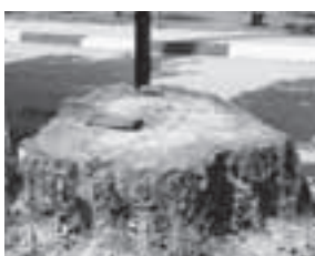
В городе всё больше пенёчков

деревьев, которые спилили возле нашей 7-й башни (Лесная, 9) и не хватает тех, которые стояли когда-то возле 8-й башни, не хватает тех, которые спилили по всему городу.