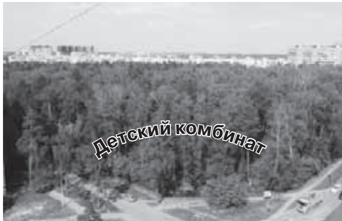
Детский сад на территории Папанинской дачи. Если бы мечта стала реальностью...

Следует отметить также неверный подход к планированию городской среды и в особенности новых кварталов с домами повышенной этажности. Эта политика идёт вразрез с политикой Администрации Московской области, которая в интересах жителей региона и улучшения среды их обитания предлагает градостроителям повсеместно отказаться от