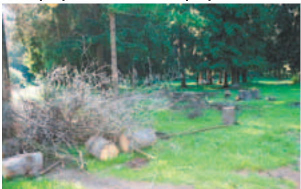
Так выглядит поляна в Комитетском лесу

В се жители уже знают, как обстоят дела в Комитетском лесу, что он заражён жуком-типографом и его надо срочно спасать. Спасать вырубкой больных и не только деревьев, иначе может погибнуть весь лес.