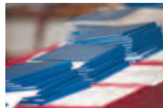
К этому они шли 11 лет