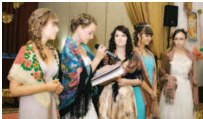
«Цыганки» нагадали всем счастья

Прощальный школьный бал – шаг в неизведанное и «неожиданное» осознание: ты – взрослый. 248 юбилейчан окончили школу в 2012 году. Из них 18 самых лучших «за выдающиеся успехи в учёбе» получили золотые медали, 14 – серебряные. И каждый аттестат – видимый результат большого многолетнего труда – первый важный шаг в неизвестную, манящую ЖИЗНЬ.