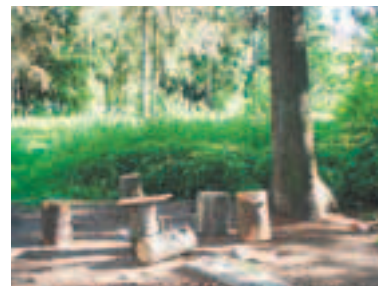
Не хотите ли присесть, отдохнуть?