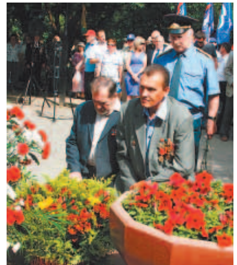
«Боевое братство» склоняется перед Великим подвигом