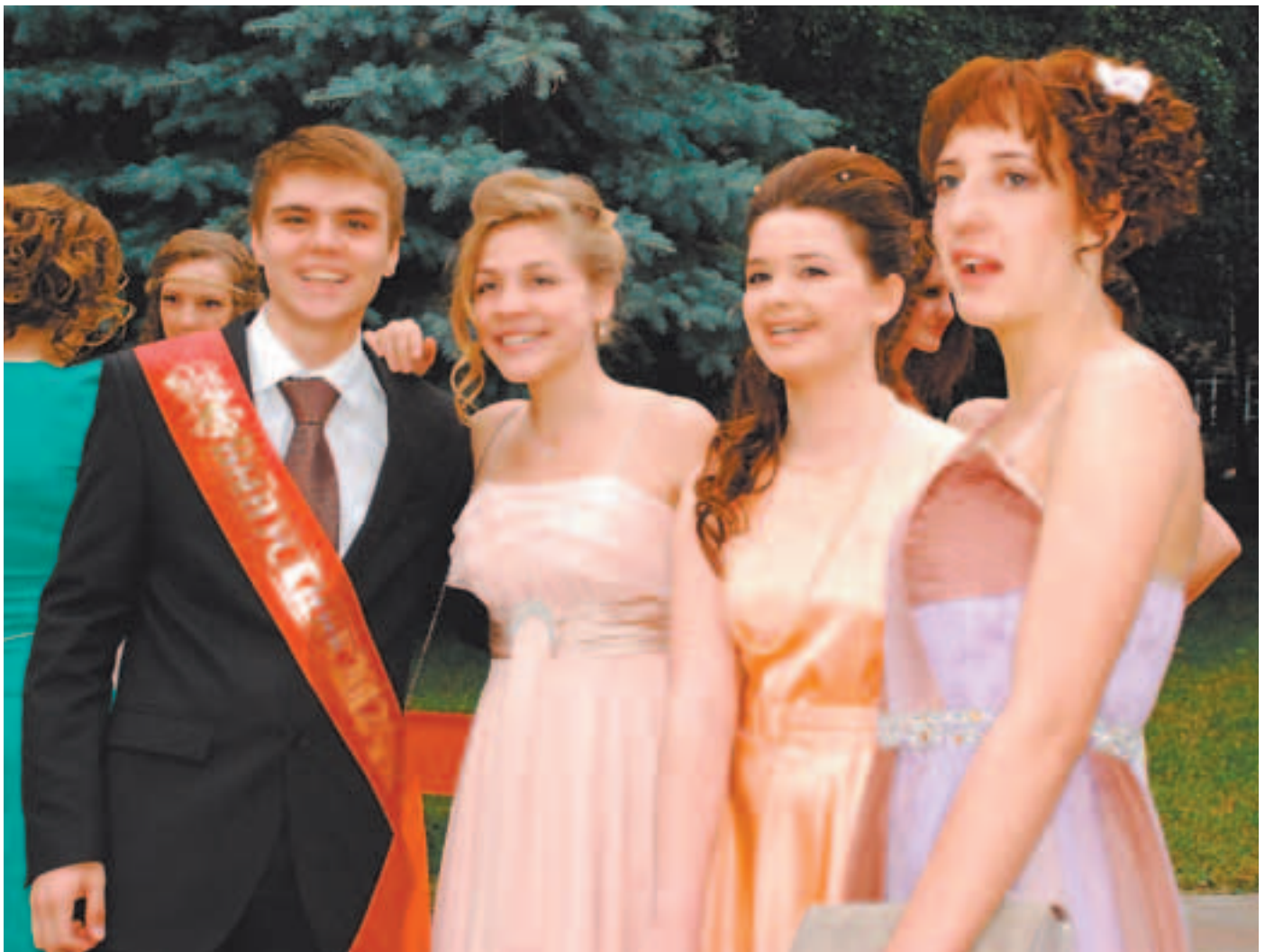
Гуляют выпускники гимназии № 3. Читайте материал о выпускном вечере в лицее № 4 на 5 странице