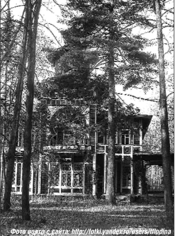
Дом дореволюционной постройки в мавританском стиле в Болшево, недавно там был санаторий «Сосновый бор», потом он был заброшен, разграблен и сожжен