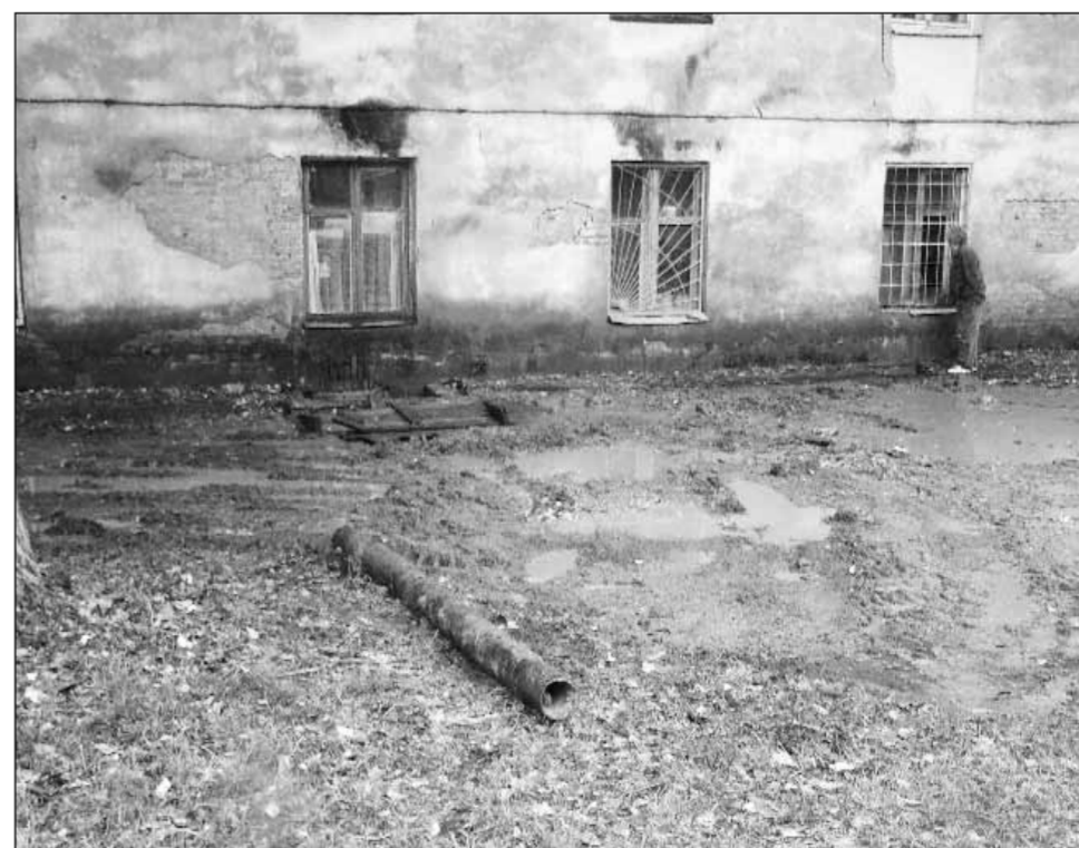
Так выглядел дом год назад, в августе 2008 г.

Обещания заселить семью в новый строящийся дом на улице Ленина остались только словами. Везде ответ был один: у города для вас квартир нет. Тем не менее, заранее предполагая, что переписка с руководством го-