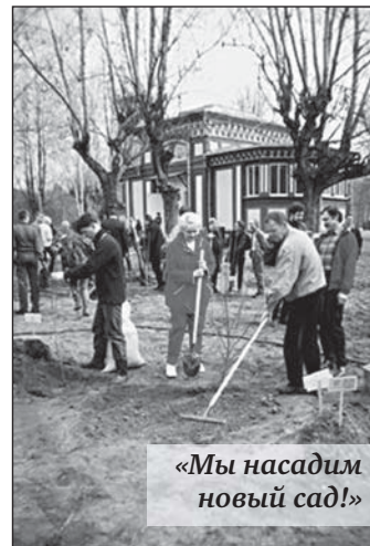
«Мы насадим новый сад!»

Предприняты попытки связаться с руководителя-