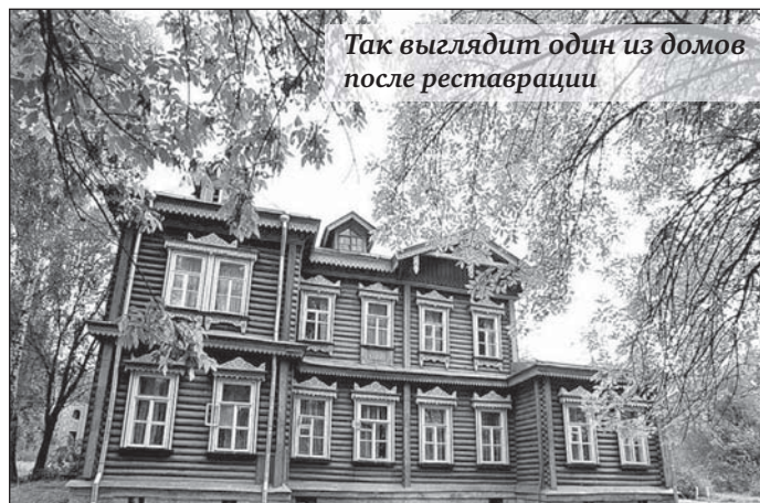
Так выглядит один из домов после реставрации

После Великой Октябрьской революции усадьбу превратили в дом отдыха, затем там был детдом для испанских детей, в Вели-