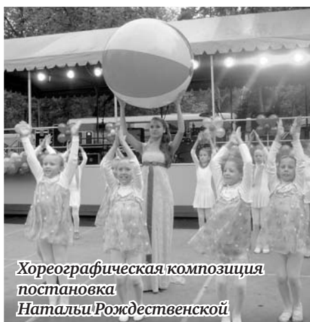
Хореографическая композиция постановка Натальи Рождественской