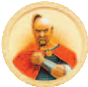
Князь Святослав Игоревич (942—972) Годы правления: 966—972

Княгиня Ольга уступила киевский престол Святославу в 966 году. Своей главной задачей князь Святослав считал преумножение славы русского оружия. Он думал только о сражениях и мечтал, чтобы все вокруг говорили о его храбрости и боялись его.