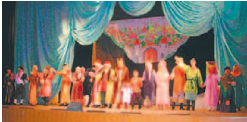
Финал спектакля «Сказка о царе Салтане»