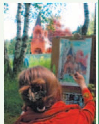
Занятия на пленэре

Творчество помогает не зачерстветь душе человека, открывая в нём всё новые и новые грани и помогая ему полностью раскрыть эмоциональные запасы души. Именно творческий процесс делает жизнь яркой и интересной, наполненной событиями и радостями. Если каждый из нас хотя бы раз посетит вернисаж в здании Администрации нашего любимого города и с помощью детских работ при-