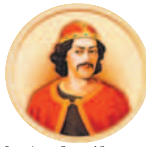
Великий князь Ярополк I Святославович (961—980)

Князь Святослав, разделив управление в государстве между тремя сыновьями, первый из русских князей ввёл обычай давать наследникам уделы ещё при своей жизни. Как показала дальнейшая история, это был «пример несчастный, который принесёт много бедствий России».