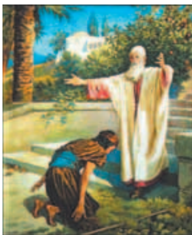
О блудном сыне

На протяжении трёх недель Церковь готовит нас к подвигу Великого поста. «Неделя» в переводе на современный язык означает «воскресный день, день ничегонеделания», а «седмица» – семь дней, неделя.