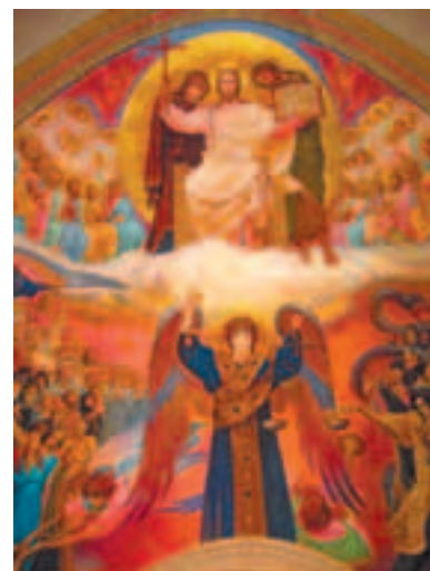
О Страшном Суде

люди, грабители, обидчики, прелюбодее, или как этот мытарь: пощусь два раза в неделю, даю десятую часть из всего, что приобретаю». В знак того, что такая гордыня удаляет человека от Бога, в эту неделю пост отменяется даже в среду и пятницу.