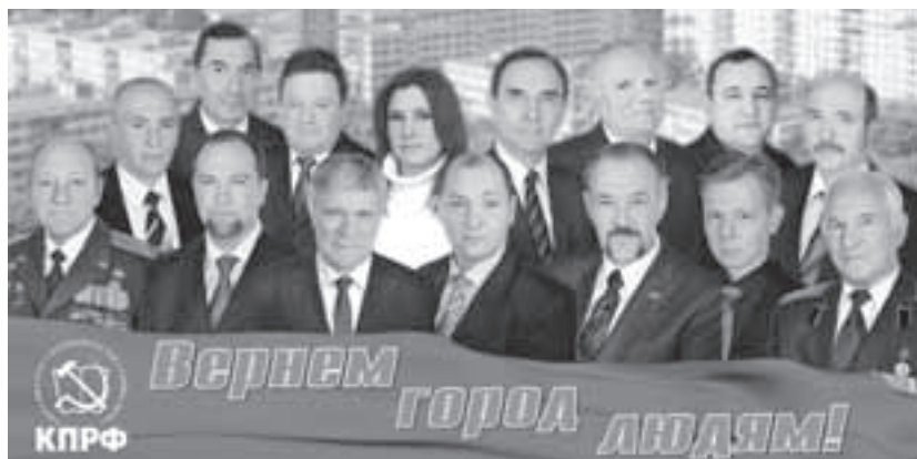
Кандидаты в депутаты Совета депутатов городского округа Юбилейный от «КПРФ»

Наша команда готова бороться за права каждого жителя Юбилейного. Мы идём, чтобы вернуть город людям.