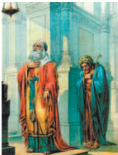
О мытаре и фарисее