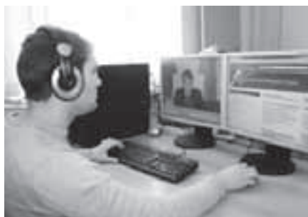
Смотрим заседания «вживую»

– Это прямая трансляция, без купюр, со всеми спо-