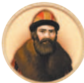
Великий князь Михаил Юрьевич (?–1176) Годы правления: 1174–1176

перестала существовать Киевская и начала свою историю Владимиро-Суздальская Русь.