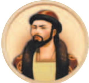
Великий князь Андрей Юрьевич Боголюбский (1111–1174) Годы правления: 1169–1174

После смерти Юрия Долгорукого в 1157 году ростовцы и суздальцы выбрали на княжение Андрея, сына Юрия. Но Андрей понимал, что ни в Киеве, ни в Ростове, ни в Суздале он не сможет стать единовластным самодержцем, ему придётся делить власть с вече и старшими боярами. Он остался во Владимире, уступив киевский престол Ростиславу Мстиславичу. А сам продолжал искать путь к самодержавному правлению над Русской землёй.