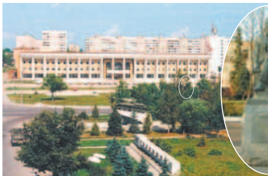
Памятник А.П. Чехову в центре города, у здания Администрации

Село Лопасня — Чёрное озеро сложилось в 1175 году из нескольких населённых пунктов: деревни Балево, сёл Зачатьевское и Садки. Расположенная на Серпуховском тракте, связывавшем Москву с югом России, Лопасня в XVIII веке превратилась в крупное торговое село. В 1872 г.