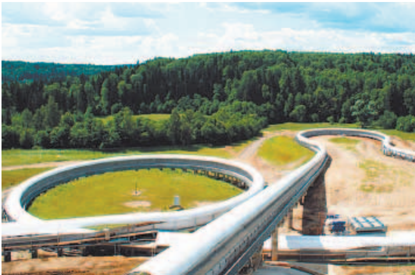
Санно-бобслейная трасса «Парамово»