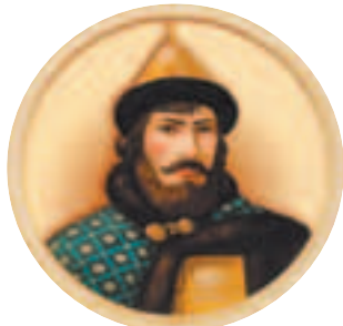
Великий князь Андрей Ярославич (1221–1264)