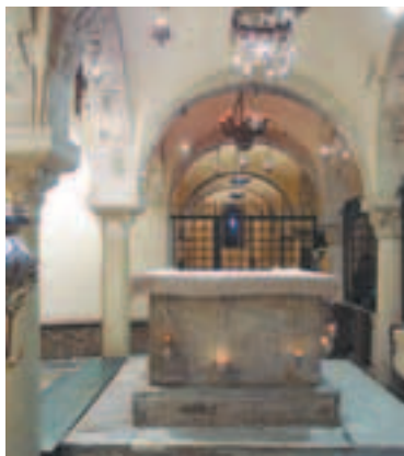
Рака с мощами Николая Чудотворца

Когда корабли прибыли в Бар, радостная весть облетела весь город. На следующий день мощи святителя Николая торжественно перенесли в церковь св. Стефана неподалёку от моря. Торжество перенесения святыни сопровождалось чудотворными исцелениями больных. Через год была построена церковь во имя святителя Николая. Событие, связанное с перенесением мощей святителя Николая, вызвало особенное почитание Чудотворца и ознаменовалось установлением особого праздника.