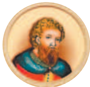
Великий князь Александр Ярославич Невский (1220–1263)

Андрей Ярославич вернулся на родину в 1256 году и был хорошо принят Александром. Великому князю удалось помирить брата с ханом. Андрей получил в удел Нижний Новгород, Суздаль и Торонец. После кончины Невского в 1263 году Андрей попытался вернуть себе титул великого князя, но хан не позволил ему этого и отдал престол его младшему брату Ярославу.