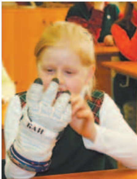
Настоящая перчатка космонавта!

Неожиданная встреча (ребят специально не предупреждали о ней) вызвала удивление и растерянность, перешедшую в восторг, и интересное свободное общение. Каждому удалось примерить настоящие перчатки от скафандра — «Ой! Какие они тяжёлые!», «жёсткие»,