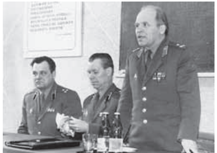
На обсуждении комплексных программ использования МКС «Буран», 8-е управление, 1977 год