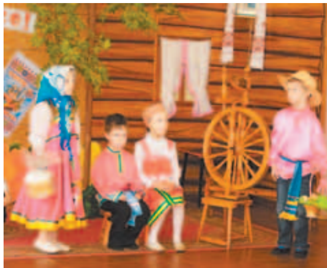
Сцена из оперы