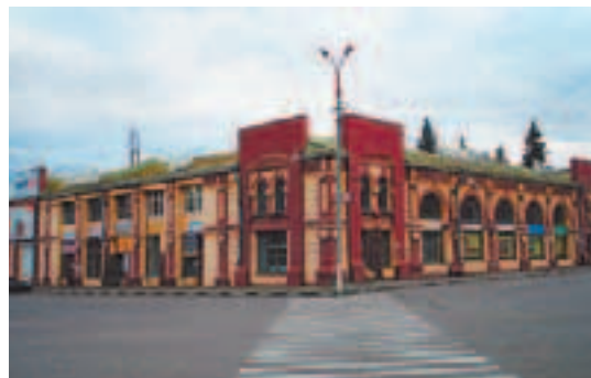
Исторический центр Серпухова. Площадь Ленина

Немецкие войска находились полукольцом к западу от города на расстоянии 6–7 километров. Серпухов защищала