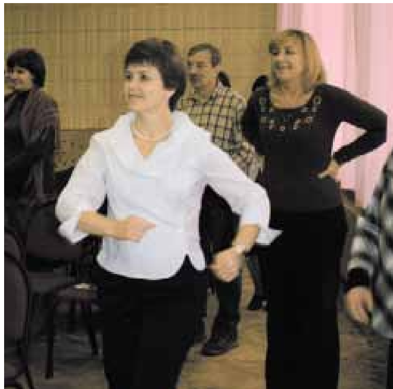
Активный шаг стимулирует работу мозга