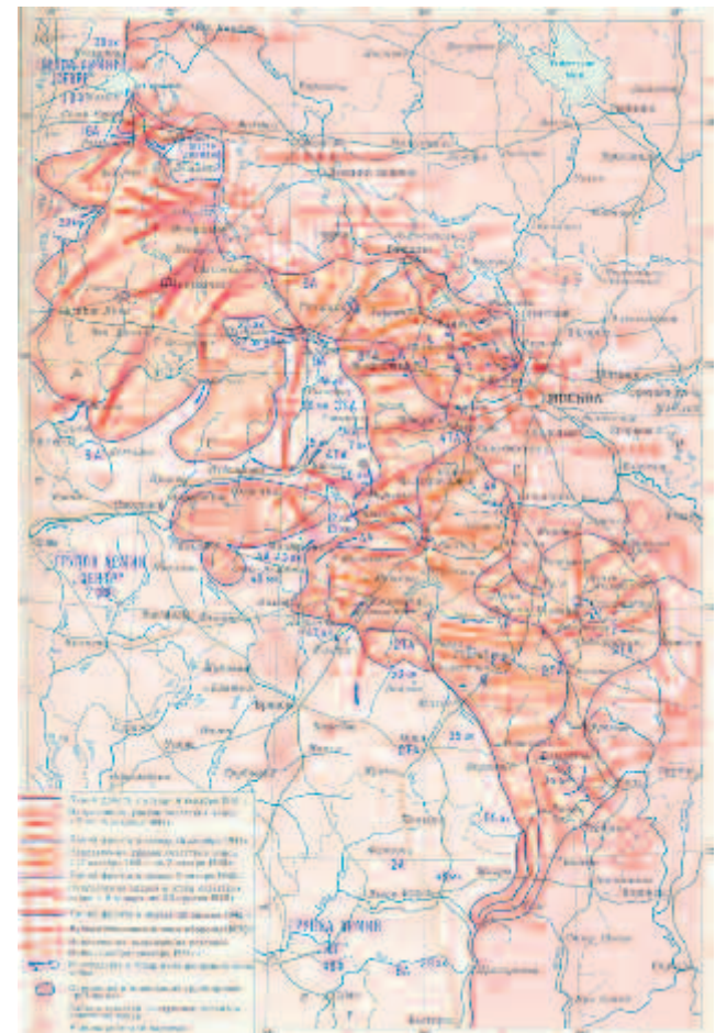
Контрнаступление под Москвой и общее наступление Советских войск на западном направлении 5 декабря 1941 г. — 20 апреля 1942 г.

В конце ноября — начале декабря войска получили значительные подкрепления. В состав Западного фронта были переданы 3 общевойсковые армии, 9 стрелковых и 2 кавалерийские дивизии, 8 стрелковых и 6 танковых бригад и большое количество специальных частей. Пополнение пришло и Калининскому, и Юго-Западному фронтам. К началу контрнаступления в составе советских войск насчитывалось 1 млн 100 тысяч человек, 7652 орудия