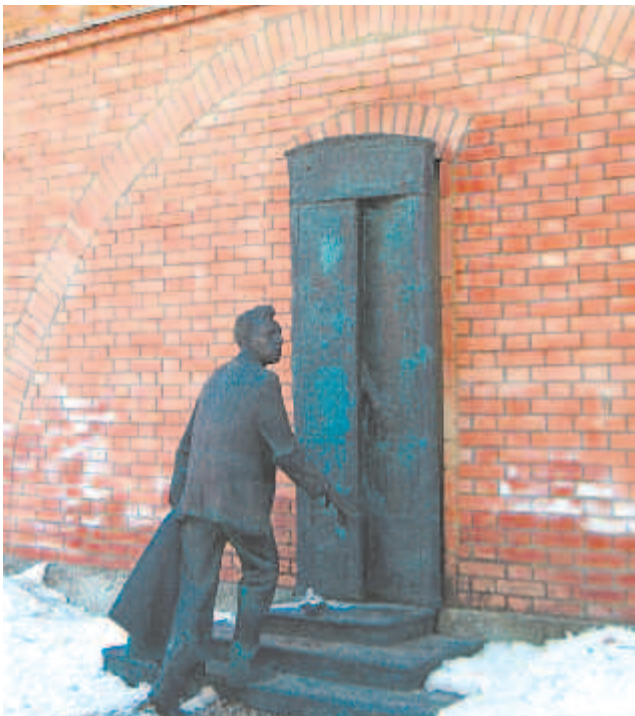
Памятник режиссёру в Пензе

В километре от барского дома печальный приют — церковь святого Михаила и усыпальница Арсеньевых — Лермонтовых. Над могилой поэта его бабушкой был воздвигнут памятник из чёрного мрамора, на нём золотыми буквами высечено: «Михайло Юрьевич Лермонтов. 1814—1841». Слева от него памятник матери поэта, со сломанным якорем на кресте, справа — памятник деду М.В. Арсеньеву. В шестнадцать лет поэт написал: «Есть место, где я буду отдыхать...» Оно здесь — в Тарханах.