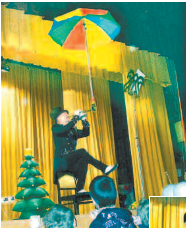
Музыканту-эксцентрику дождь был не страшен