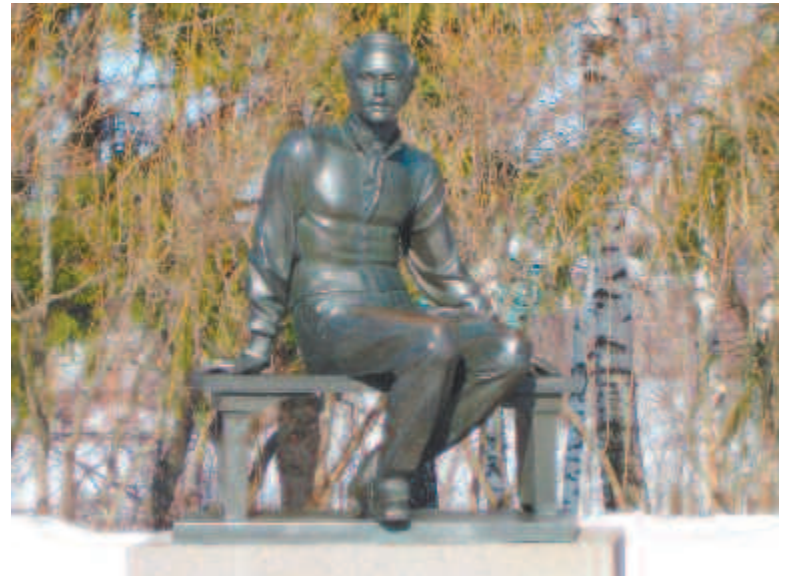
Памятник поэту в Тарханах

Но главное в Тарханах, конечно, Лермонтов. В Доме ключника