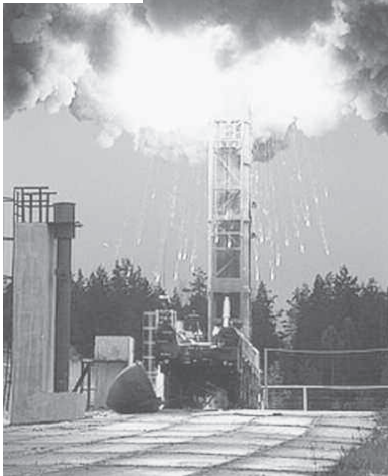
Запуск российской межконтинентальной баллистической ракеты «Тополь-М»

17 декабря 2009 года исполнилось 50 лет со дня создания Ракетных войск стратегического назначения, в этой связи обратимся к их истории, сосредоточив внимание на политико-правовых аспектах создания РВСН. Как известно, после окончания Великой Отечественной войны интересы обеспечения военной безопасности СССР диктовали необходимость пересмотра концепции строительства Вооружённых сил с учётом новых угроз военной безопасности — началось стратегическое противостояние с США и их союзниками по блоку НАТО. Обострение военно-политической обстановки, произошедшее с началом «холодной войны», а также быстрое развитие в США и других странах НАТО стратегических наступательных вооружений, представлявших реальную угрозу интересам безопасности нашего государства, обусловили необходимость создания в сжатые сроки отечественного ракетно-ядерного оружия и формирования Ракетных войск стратегического назначения. В интересах правового обеспечения создания ракетно-ядерного оружия и строительства нового вида Вооружённых сил — Ракетных войск стратегического назначения, в послевоенные годы были разработаны и приняты соответствующие нормативные правовые акты.