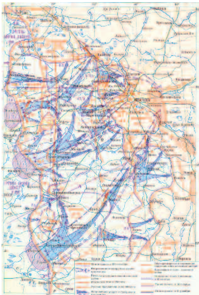
Героическая оборона Москвы 30 сентября — 5 декабря 1941 года

На московском направлении во время подготовки операции «Тайфун» противник сосредоточил 1 млн 800 тысяч человек, свыше 14 тысяч орудий и миномётов, 1700 танков и 1390 самолётов. Немецкое командование основные силы развернуло в трёх компактных группировках. Это обеспечило им