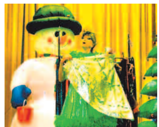
Секреты мгновенного переодевания видел только снеговик