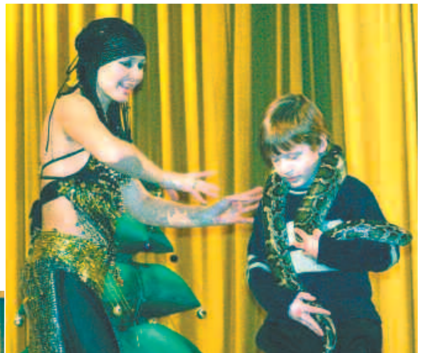
Храбрые ребята живут в Юбилейном, не испугались они страшной Бабы Яги и с удавом нашли общий язык