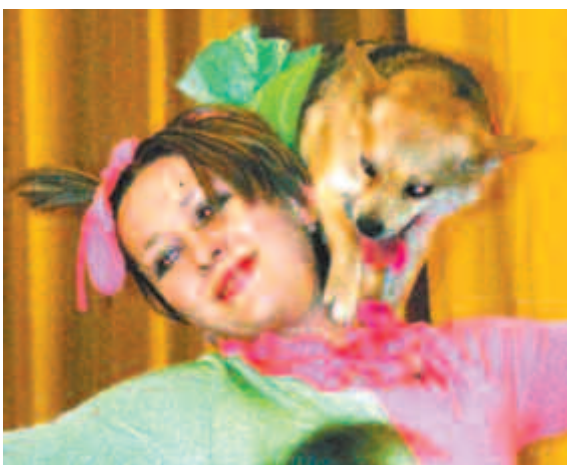
Дрессированные собачки ещё раз подтвердили, что они лучшие друзья человека