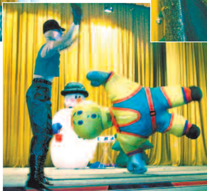
Добрые улыбки вызвал надувной «богатырь»