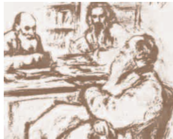
Н.Ф. Фёдоров, В.С. Соловьёв и Л.Н. Толстой