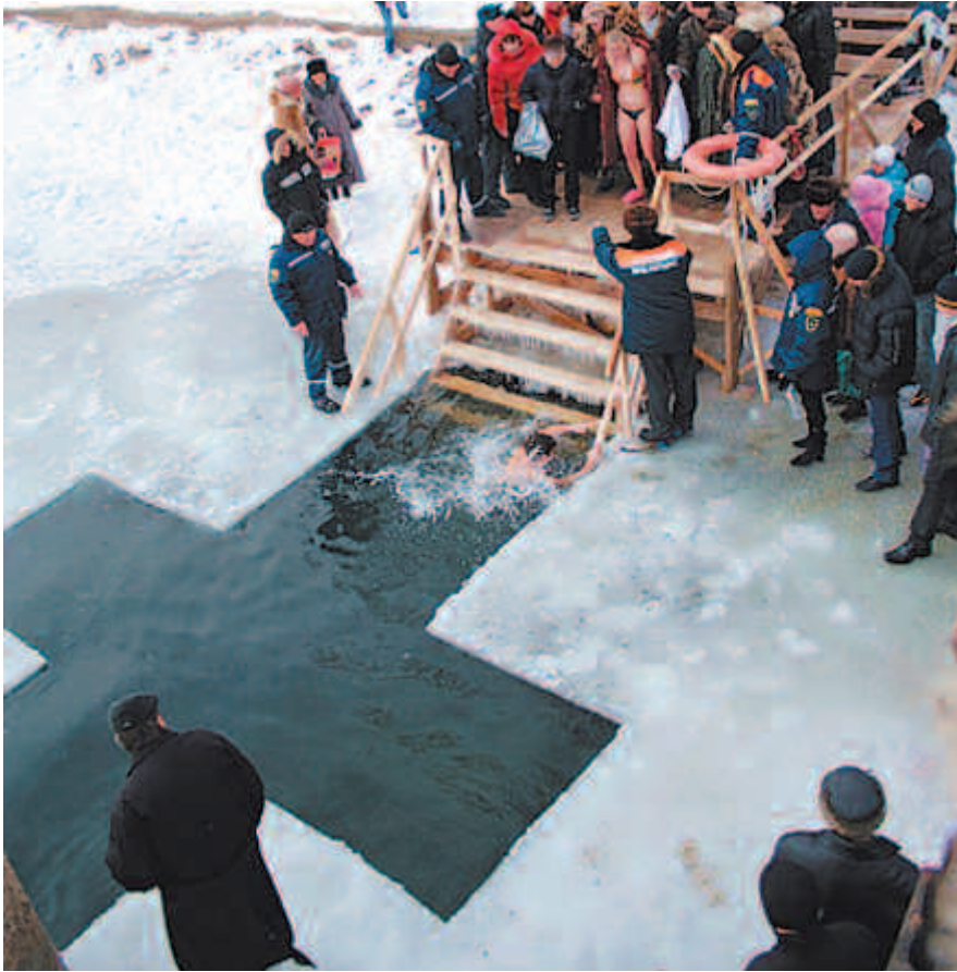
Крещенское купание в проруби

шку, подпоясанный кожаным поясом. Строгое, смуглое лицо с горящим взором привлекало к нему внимание людей. Это был Иоанн Креститель, Предтеча — предшественник Иисуса Христа. Иоанн пророчествовал народу о скором пришествии Спасителя и проповедовал покаяние. Тех, кто каялся, Иоанн крестил в водах реки Иордан и отпускал грехи. Так первый пророк Нового Завета готовил людей к пришествию Спасителя.