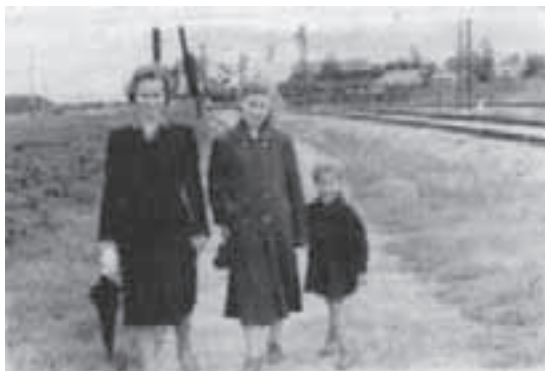
1957 год. Большевикское картофельно-клеверное поле, Фрязинская ж/д ветка. Сейчас здесь Фрязинская платформа.