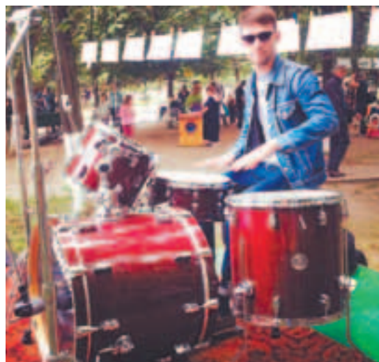
Музыка создавала настроение

участие 65 авторов из 5 стран (Россия, Украина, Литва, Чехия и Тайланд) и 25 городов! Мы растянули более 250 метров верёвки! И использовали более 1000 прищепок, чтобы повесить 520 работ наших участников! На территории были представлены 13 авторских разрисованных и расклеенных стиральных машинок! Весь день в парке был бесплатный Wi-Fi). На 3 музыкальных площадках: главной, альтернативной и диджей-сцене