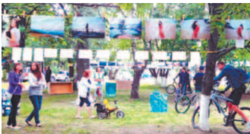
Фотостирка была масштабной — 250 метров верёвки и более 1000 прищепок :)))