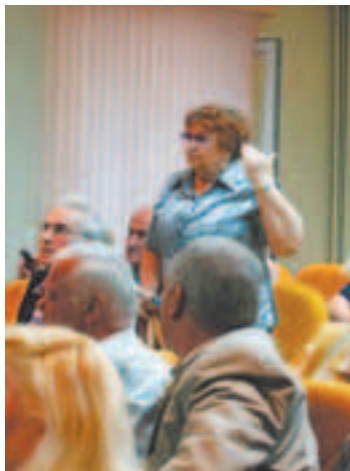
Жительница дома № 36: «Мы против»