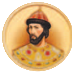
Великий князь Симеон Иванович Гордый (1316–1353)

возвышение и укрепление Москвы и её власти над всеми русскими городами.