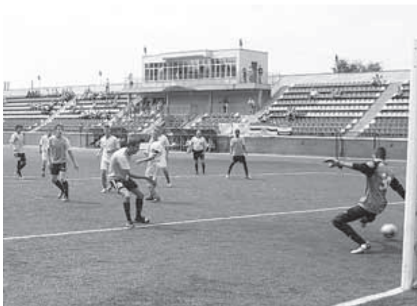
Удар по воротам...