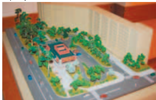
Так может выглядеть этот район