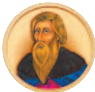
Великий князь Иван Данилович Калита (?–1341)