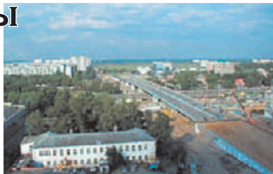
Новый мост в Люберцах

В Великую Отечественную войну десятки тысяч люберчан поднялись на борьбу с врагами. За героический труд для фронта завод был награждён орденами Ленина и Трудового Красного Знамени. В июне 1943 года в Люберцах была создана Высшая офицерская школа воздушного боя ВВС Красной Армии. В ней получили подготовку 589 лётчиков фронтовой авиации, 43 из них стали Героями Советского