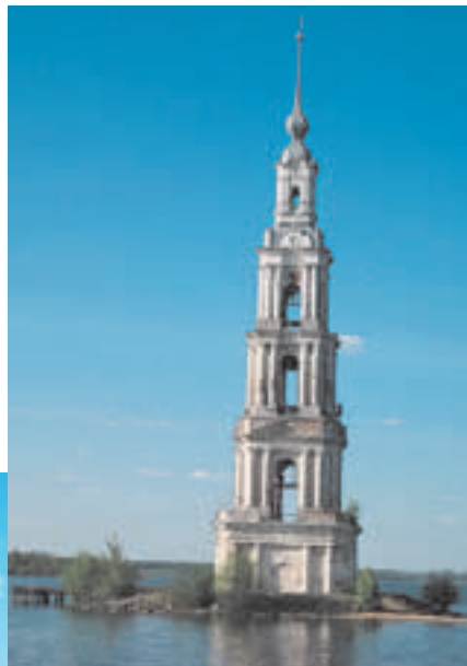
Колокольня Никольского собора

Погибли под водой старинные купеческие дома, церкви, монастыри... Всё, что нельзя было разобрать и перенести (а практически весь город), просто разрушали, чтобы не торчало из-под воды, не мешало судоходству. И только одна пятиярусная 75-метровая колокольня Никольского собора