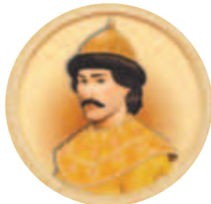
Царь Фёдор Борисович Годунов (1589—1605) Год правления: 1605

Годунов всё же был законным царём, и по праву престол наследовал его сын Фёдор. Это был очень умный и образованный юноша, нравившийся всем окружающим. Борис уделял много времени образованию и воспитанию сына.