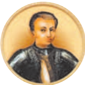
Царь Лжедмитрий I (?—1606) Годы правления: 1605—1606

По приказу Лжедмитрия Фёдора и Марию Годуновых удушили. Народу объявили, что царь и царица покончили жизнь самоубийством. Их тела выставили на всеобщее обозрение. Выкопали и гроб с телом Бориса Годунова. Всех троих без проведения церковных обрядов похоронили в бедном Варсонофьевском монастыре.