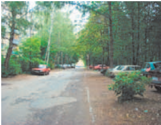
Лесная и её пешеходы в ожидании благоустроителей