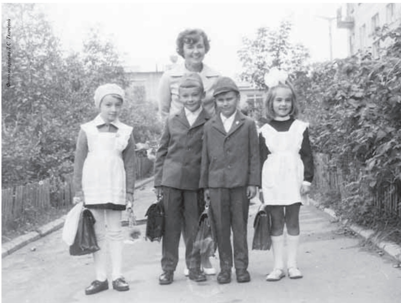
В 1-й класс! Болшево, 1970 год. Поздравления с Днём знаний читайте на 7 странице