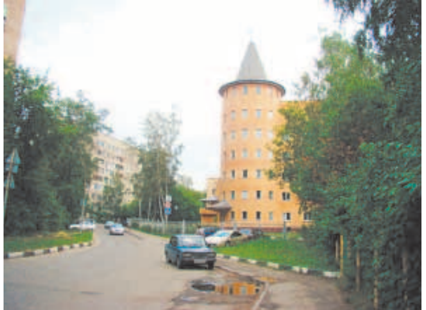
Улица Лесная, новое здание городской больницы

тельстве «финского» посёлка, появившегося на опушке Комитетского леса в 1947–1948 годах. Тогда же получила и своё название — Лесная. Через несколько лет вместо «финских» домиков для сотрудников НИИ-4 появились девятиэтажные дома, а когда свободного места для строительства жилья не осталось, высотки начали теснить дачи в посёлке «Ленинец».