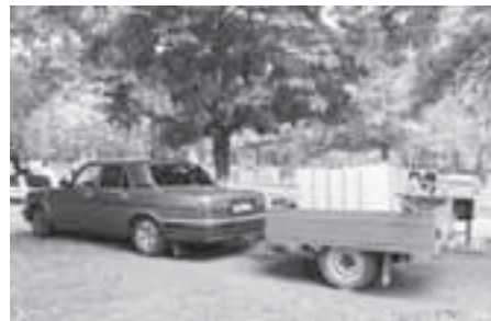
К нам приехали полить клумбы?..

...Очень молодой, энергичный человек, вернувшись к машине, пояснил, что сам он из Ногинска и приехал к нам в город, чтобы ухаживать за клумбами. В кузове прицепа он