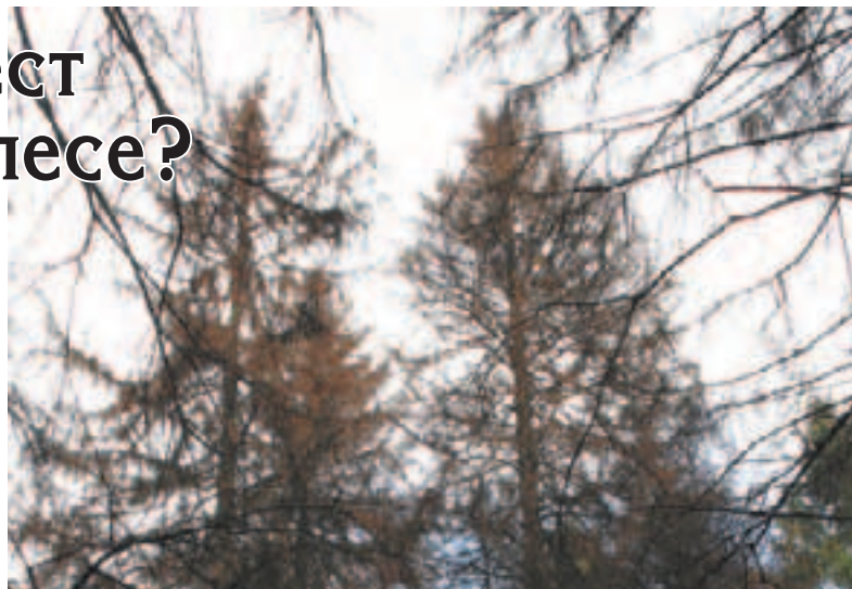
Так будет выглядеть в скором времени весь лес

...На большой поляне в лесу подрастает новое поколение ёлочек и сосенок, пока их почти не видно среди выросших за лето