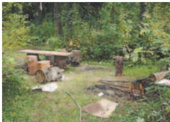
Укромная полянка пустует в будний день, но по оставленному мангалу видно, что весёлая компания сюда ещё вернётся