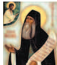
Преподобный Силуан Афонский

Своей подвижнической жизнью он явил пример кротости, смирения и любви к ближним. 24 сентября 1938 года схимонах Силуан мирно скончался.