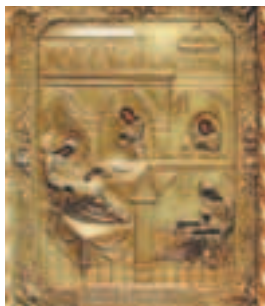
Глинская икона Рождества Пресвятой Богородицы

тери, явленная в начале XVI века. По древнему преданию, записанному иноками, в лесу, окружавшем пустынь, пчеловоды, осматривая ульи, выдолбленные в дереве, увидели на одной из больших сосен икону Рождества Пресвятой Богородицы, озаряемую чудесным светом, и были объаты страхом. С того времени люди стали приходить к новоявленной иконе. Благодать Божия молитвами Пречистой Богородицы исходила от Её образа, исцеляя болезни и даруя надежду. Из-под корня сосны, ознаменованной явлением, истекал целебный источник.