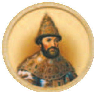
Царь Михаил Фёдорович Романов (1596–1645)