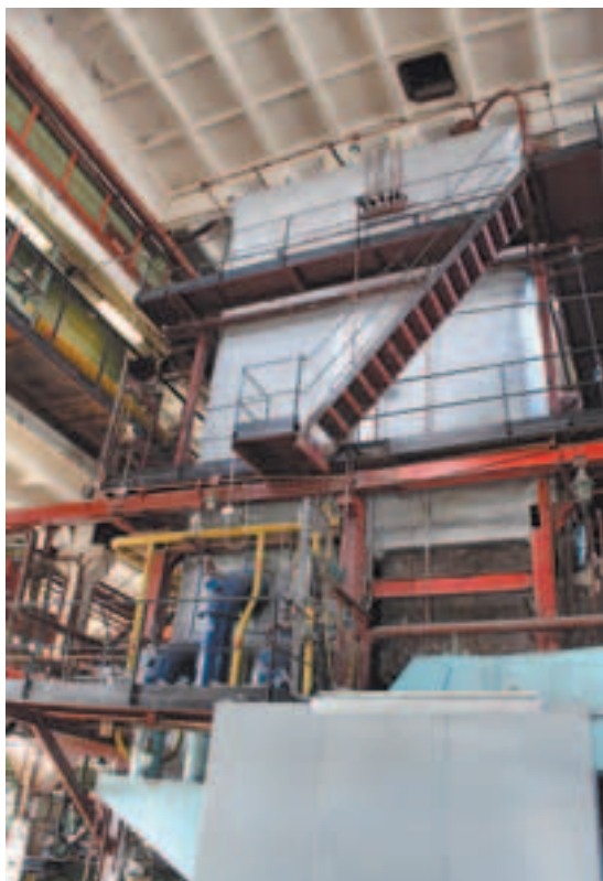
На котельной 3 «а»

Беседовала Наталья ПОДОЛЬСКАЯ