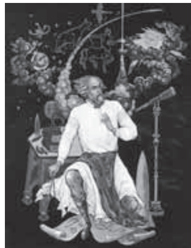
Страницу подготовила Оксана ПРУДКОВСКАЯ

Исследователи до сих пор удивляются прозорливости Циолковского, который предсказал и современные шлюзовые камеры, и скафандры для выхода в открытый космос. Сегодня у землян есть свой дом на орбите планеты — Международная космическая станция. Идея околоземной станции также принадлежит Циолковскому.