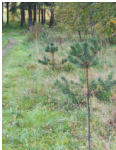
Молодые сосенки — это наша надежда