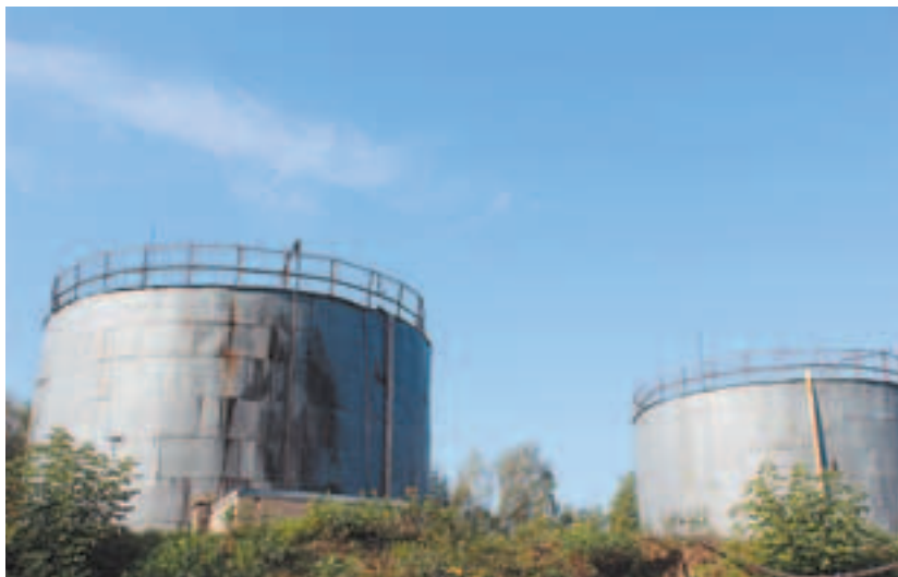
Мазутохранилище заполнено свежим резервным топливом

— Проведены ремонтно-профилактические работы над сетевыми насосами системы отопления на котельной 3«а».