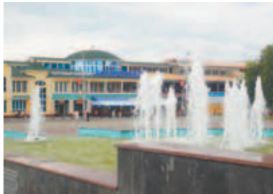
Ногинск — город фонтанов

Главной достопримечательностью города является Богоявленский собор. Это старейшее каменное здание, построенное в 1767 году. Собор всегда славился колоколом, который весит 1250 пудов (около 20 тонн) — самым большим из всех уездных колоколов России. На главной улице города — III Интернационала — расположены Торговые ряды, построенные в конце XIX века. Напротив возвышается здание бывшей