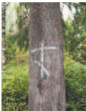
Кто-то поставил крест на одном дереве. Или на всём лесу?