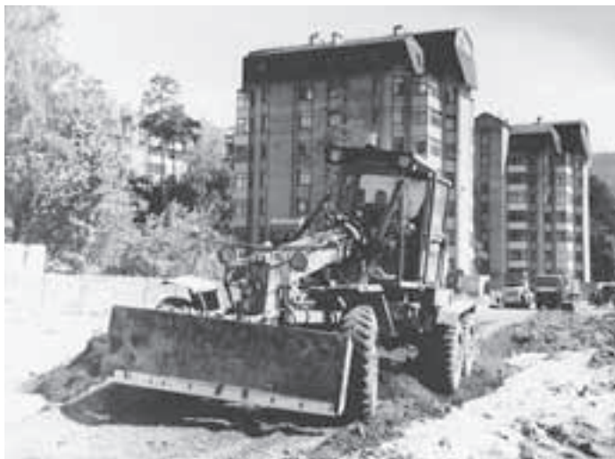
Возрождение Пионерской улицы