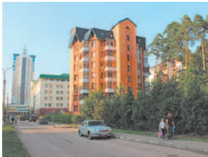
Часть улицы Пионерской — красивой границы между Юбилейным и Королёвым