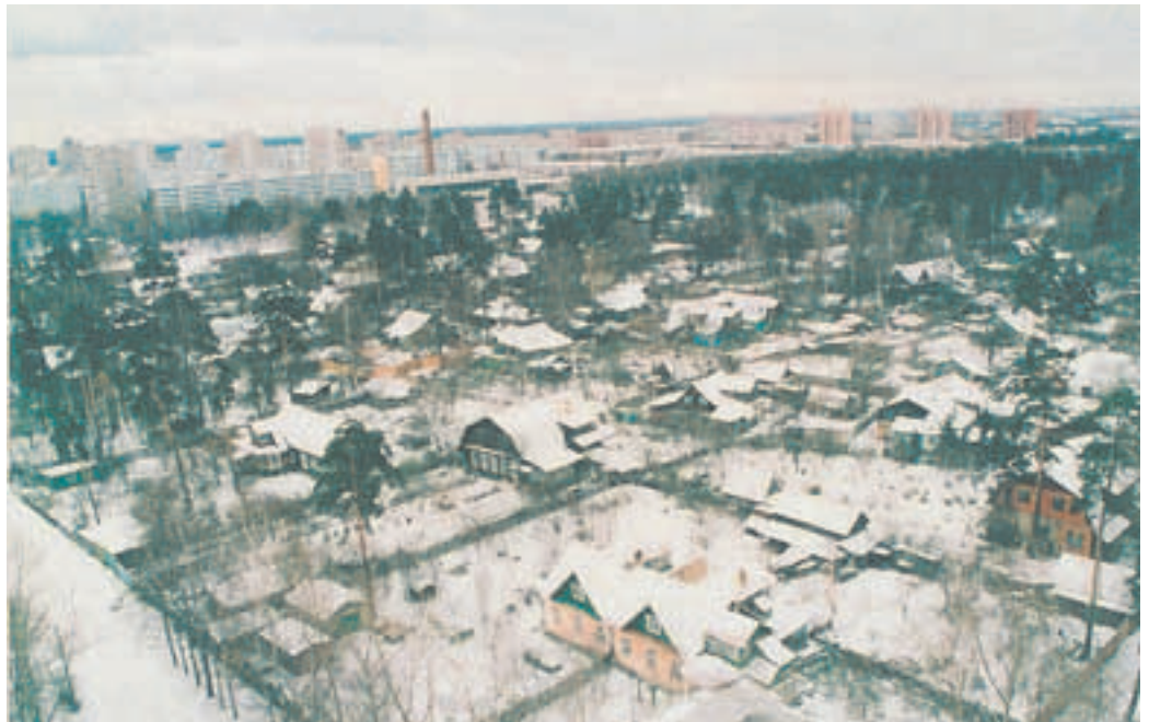
Так сверху выглядел жилой квартал между Ленинской, Маяковского, Малой Комитетской и Комитетской улицами. На фото: слева – М.Комитетская, справа – улица Маяковского

В 1920 г. в бывшем имении Крафта в Костине был организован совхоз. Здесь с 17 января по 1 марта 1922 года жил и работал Владимир Ильич Ленин. Дом этот решением компартии в 1939 году превращён в музей. Здесь принимали в пионеры. В кварталах довоенной застройки сохранились элементы планировки того времени: улицы Коминтерна, Октябрьская, Кирова, Ленина лучами расходятся от небольшой и дачной застройки посёлка Болшево, чья традиция, улицы тоже носили революционные имена: Ленинская, Пионерская, Рабочая, и названная в честь певца социализма В. Маяковского.