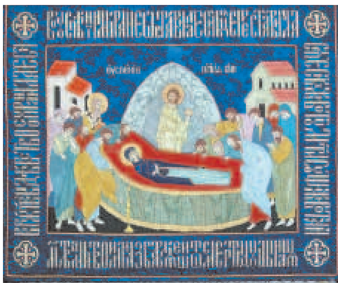
Плащаница, которая полагается в центре храма в праздник Успения

Смерть издревле казалась человеку величайшей из всех загадок бытия, она всегда вызывала страх и трепет, потерянность и недоумение. Простой человек не знает даты своей смерти, она сокрыта от нас Господом. Но Божией Матери дату Ее кончины возвестил Архангел Гавриил. Она встретила эту весть с радостью, ведь возведенная дата кончины утвердила Ее в надежде на скорую встречу со Ее возлюбленным Сыном.