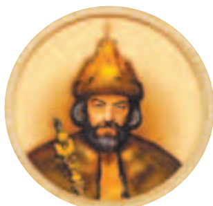
Царь Борис Фёдорович Годунов (1551—1605)