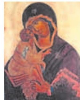
Донская икона Божией Матери

В 1591 году войско крымских татар подступило к Москве, разбив стан на Воробьевых горах. Москвичи совершили вокруг Москвы крестный ход с чудотворной Донской иконой. В день битвы, 4 июля, святой образ находился среди ратников в походной церкви во имя Преподобного Сергия Радонежского. Враги, устрашенные знаменем Пресвятой Богородицы, обратились в бегство. В благодарность за Ее милость, явленную через Донскую икону, в 1592 году на том месте, где икона стояла среди воинов, был воздвигнут каменный храм и основан Донской монастырь.