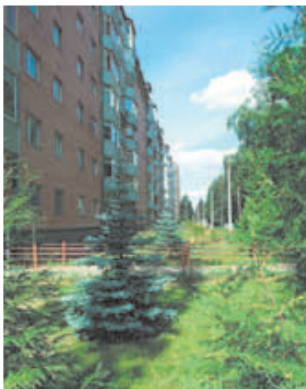
Ленинская улица. Справа — «Папанинская дача»