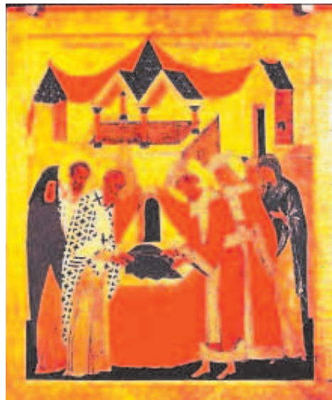
Апостолы, отвалив камень от гроба Богородицы, нашли лишь её одежды

Православная Церковь верит, что Богоматерь воскресла на третий день после Своего Успения, подобно тому, как воскрес Ее Сын, и вознеслась телесно на небо, подобно тому же, как на сороко-