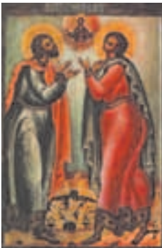
Мученики Флор и Лавр

Почитание святых мучеников Флора и Лавра было особенно велико в древней Руси. Особое отношение к этим мученикам как покровителям домашнего скота и помощникам в крестьянском труде было воспринято нашими предками от южных славян. Именно в землях древней Иллирии жили святые братья. Там же они пострадали за Христа и приняли мученические вены. Их житие — пример подлинной христианской любви. Это любовь братская: Флор и Лавр во всем были единомышленниками. Любовь к наставникам — Проклу и Максиму, которые научили братьев ремеслу каменотёсов и богоугодной жизни. Любовь к ближним — братья раздавали все заработанные деньги нищим. Любовь к врагам — они исцелили сына языческого жреца Мамертина, а его самого обратили к Христовой вере. Явили святые и высшую любовь — к Богу, добровольно избрав мученичество за Христа.