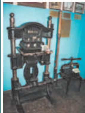
Печатный станок 1930-х годов — гордость старейшей типографии Подмосковья

графичесного фальцаппарата. Максимальная производительность — до 30 000 экземпляров/час. Машина предназначена для круглосуточной эксплуатации при выпуске продукции формата А2 и А3 максимальным объёмом и красочностью. Высокий уровень автоматизации машины обеспечивает переналадку на новый тираж за короткое время и позволяет типографии снизить себестоимость работ за счёт уменьшения количества отходов.