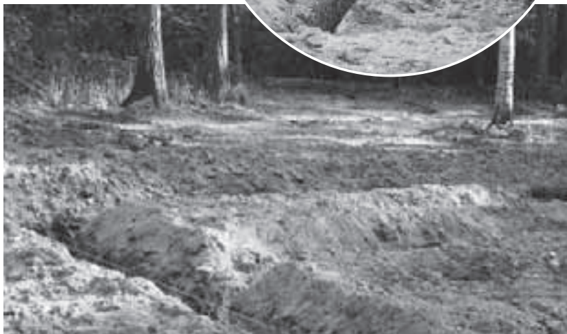
Траншеи для закладки ленточного фундамента уже выкопаны...