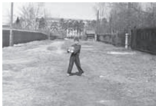
Ул. Парковая, 1962 г.