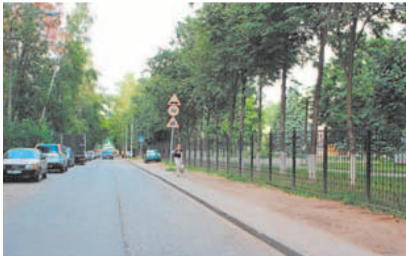
Вид на ул. А.И. Соколова

Заметным явлением в решении жилищной проблемы для военнотружеников и их семей стало начало капитальной застройки территории финского городка. В 1966 году здесь приступили к сносу финских домиков. На их месте возводили кирпичные многоэтажки. Первый построенный здесь десятиэтажный дом в народе прозвали «генеральским» (сегодня это дом № 4). В его западные окна буквально заглядывали ветви великолепных елей