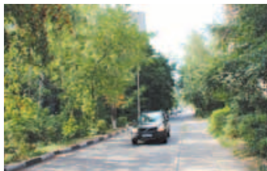
Ул. Парковая, 2012 г.