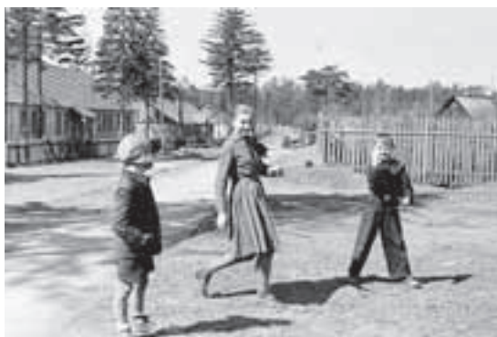
Детям нравится здесь гулять