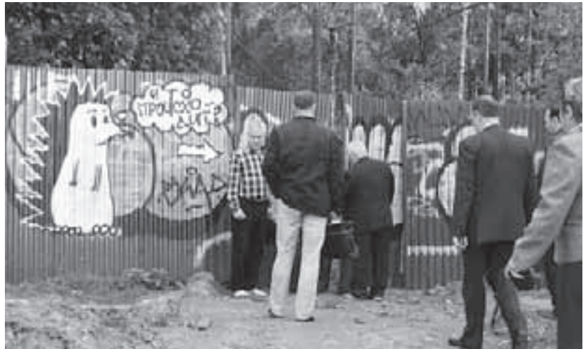
Представители Совета депутатов на месте события

регулируется действующим законодательством и должно проводиться с соответствующего разрешения, в данном случае органов местного самоуправления, — отметил А.Д. Раевский, — т.е. на любой объект разрабатывается исходно-разрешительная документация, владелец участка и предполагаемого строения обращается в местную Администрацию (в данном случае города Юбилейного), представляет всю исходную документацию и получает разрешение на строительство. После окончания строительства законченный объект представляется комиссии Управления архитектуры Администрации для принятия решения о принятии объекта в эксплуатацию. В данном случае имеет место явное нарушение законодательства: мы видели начало копания фундамента, однако никакого разрешения на это органы местного самоуправления г. Юбилейного не давали. В этой связи по