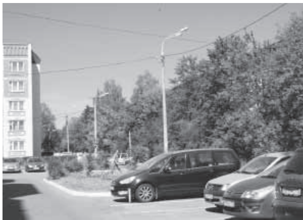
На улице Б. Комитетской