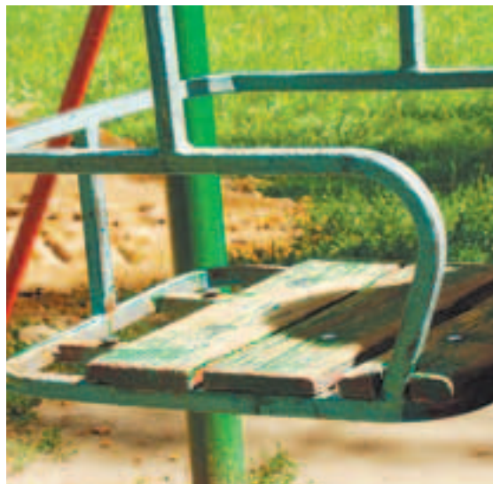
А это качели, на которых рвутся штаны