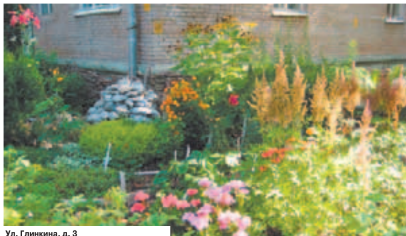
Ул. Глинкина, д. 3

«мохнатый» шмель, задорно выглядывают из-за жёлтого заборчика и цветных бегоний розовые свинки, среди настигший загорает зелёный удав в очках и шляпе, «позируют» красавцы-мухоморы. Повыше на дереве — улей волшебных золотистых пчёл, а рядом ещё один, к которому «лезет» за сладким мёдом