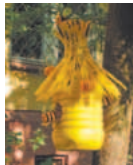
Ул. А.И. Тихомировой, д. 3

косоплapyй мишка. Невероятно, но всё это сделано из пустых пластиковых ёмкостей всех размеров (от больших пятилитровых до киндер-сюрпризов). Случайно однажды увидев это чудо, сейчас, идя по делам, я стала проходить здесь специально — поднять настроение, полюбоваться сказкой. Спасибо всем, кто подарил нам эту красоту!