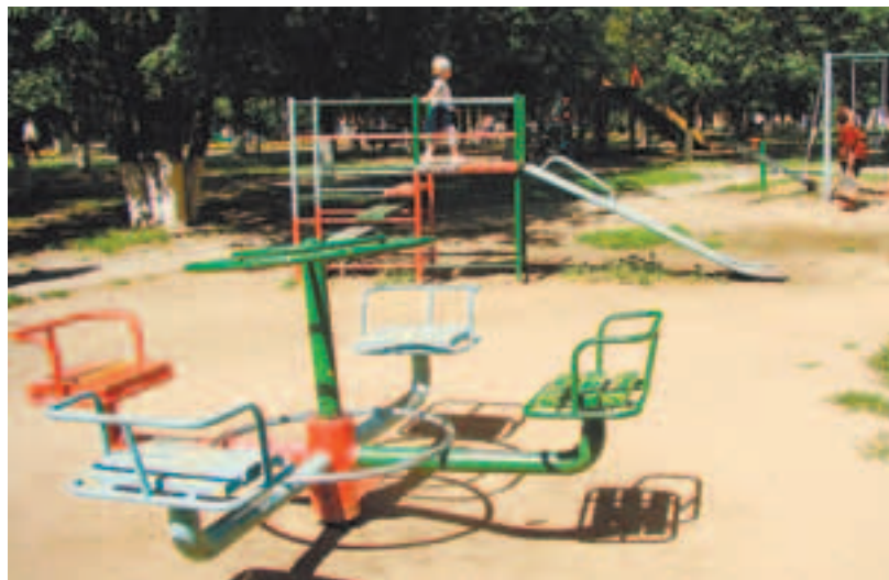
В сквере 3-го микрорайона карусели наклонились, и «руль» остаётся в руках тщательно пытающихся покататься ...