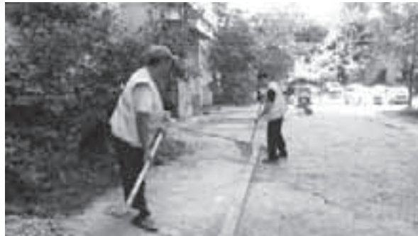
Работники дорожного хозяйства МУП «ЖКО» заканчивают подготовку к асфальтированию у дома № 3 по Школьному проезду