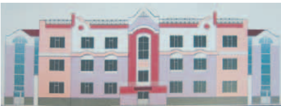
Макет будущего детского сада

т.п. С 1 сентября 2013 года новый корпус должен принять малышей.