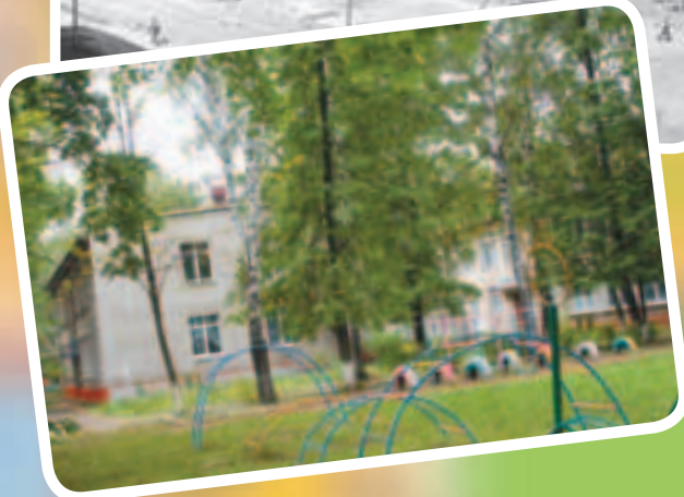
1961 год – всё только строится: детский сад № 37 «Рябинка», Болшевская школа № 3 (сейчас школа № 1 города Юбилейного). Сегодня снять такую панораму нельзя – сверху «зелёное море», закрывающее не только детский сад и школу, но даже пятиэтажки