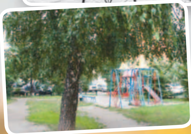
На Большой Комитетской за 10 лет многое изменилось. Но детская площадка всё там же, только деревья подросли...