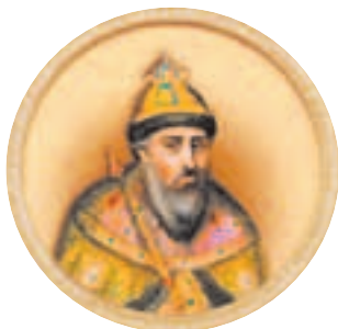
Царь Василий IV Иванович Шуйский (1552–1612)