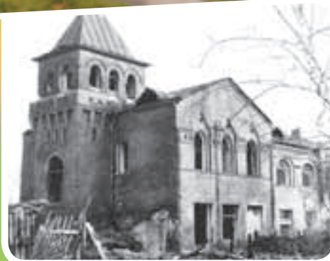
«Мадрид»... В городе Юбилейном уже нет такого места, но это было где-то здесь