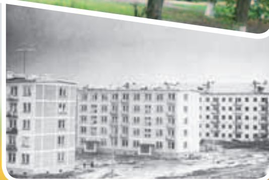
Сегодня эти дома (сейчас ул. М.М. Глинкина) и стадион спрятались за деревьями парка. Спасибо всем, кто когда-то их посадил