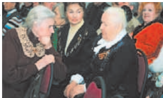
Им есть о чём вспомнить...