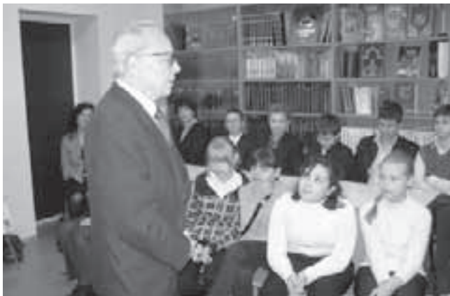
Виктор Георгиевич всегда уделял много времени воспитанию подрастающего поколения

Удачелов, мучитель слов, искатель у кругов углов и мастер каверзных узлов; растратчик денег, мыслей, дней; рифмовщик пней, корней, огней; певец и света, и теней, восторгов и сомнений, я в быстрине мгновений покорно растворяюсь и снова превращаюсь то в чью-нибудь удачу, то в сдачу, то в придачу, в большой вопрос, в задачу,