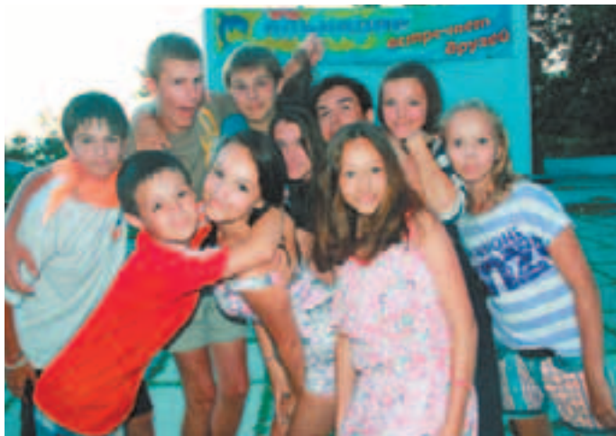
Мы все вместе!