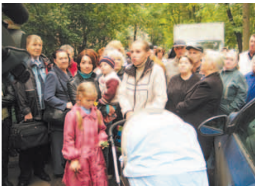
Мамы хотят купать детей в горячей воде

Митинг собрал около ста человек: ни пенсионеры, ни молодёжь, ни мамы со своими детьми не остались равнодушными ведь проблема касается каждого. Люди хотели знать, когда же в двадцать первом веке они смогут жить по-человечески?! Когда молодые мамы смогут купать детей в горячей воде, врачи делать уколы не окоченелыми руками, а детишки в детских садах умываться тёплой водой? Собравшиеся были недовольны тем, что власти закрывают глаза на их проблему. Многие задавались вопросом, куда же уходят деньги, и как котельная оказалась должником. Звучали даже предложения средства на проведение Дня города потратить на решение проблемы: какой юбилей, когда сотни людей находятся в бедственном положении! Митингующие требовали, чтобы котельную передали с баланса Министерства обо-