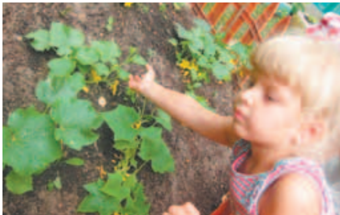
Где там огурец на грядке?

Но не только огурцами занимались в «Теремке» в весёлые летние дни. Одним из важнейших вопросов в работе дошкольного учреждения в это время является организация досуга детей. Как сделать так, чтобы привычные игры не наскучили? Как объединить и построить игровую деятельность так, чтобы было интересно и малышам, и старшим дошкольникам? Как организовать жизнь ребёнка в детском саду так, чтобы способствовать укреплению здоровья, эмоциональному, личностному и познавательному развитию? Здесь педагогу важно найти баланс между самостоятельной активностью детей и педагогической