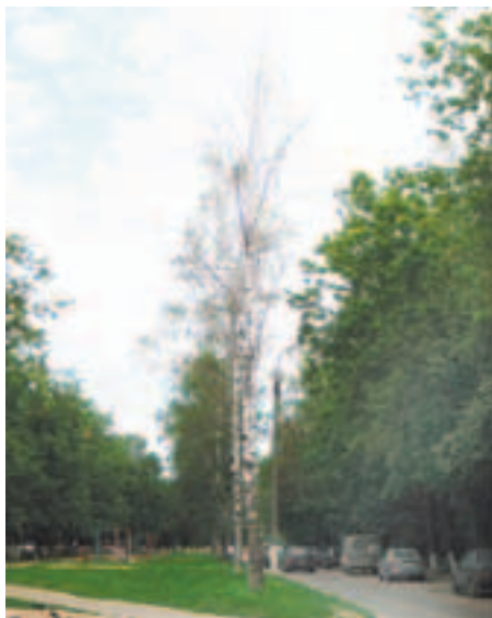
В парке гибнет целая берёзовая аллея