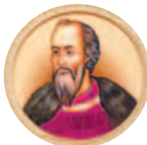
Великий князь Василий I Дмитриевич (1371—1425) Годы правления: 1389—1425

В асилий считал, что самыми важными задачами его правления должны быть три: облегчить ярмо татарского ига; удержать литовцев от захвата русских земель; усилить великое княжение присоединением независимых уделов. Василий Дмитриевич женился на дочери литовского князя Витовта по данному ему обещанию.