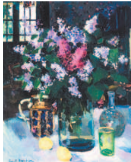
Сирень. 1915 г.

этих мест легли в основу десяти выставочных панно павильона Крайнего Севера, заказ на проектирование и оформление которого был сделан Коровину для Всероссийской промышленной и художественной выставки 1896 года в Нижнем Новгороде.