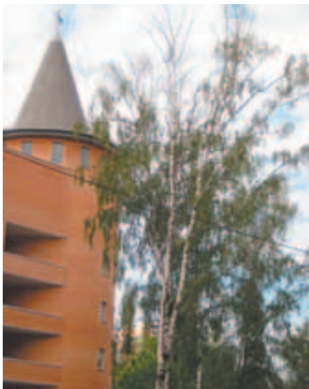
В плохом состоянии берёза около больницы