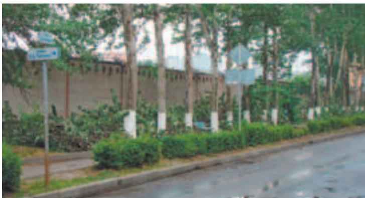
На улице А.И. Нестеренко и во 2-м городке произведена обрезка деревьев