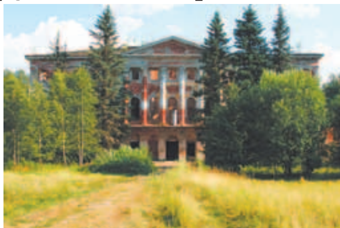
Главное здание усадьбы. Современный вид

С 1960 г. Гребнёво — памятник архитектуры республиканского значения.