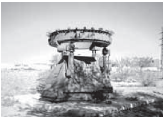
Увековеченный наземный старт

— А какое у Вас есть хобби? — Слышу я и отбиваю ключ, отвечая: — Танцы. Товарищ полковник! — Думаю, он безмерно удивился, но ничего не сказал.