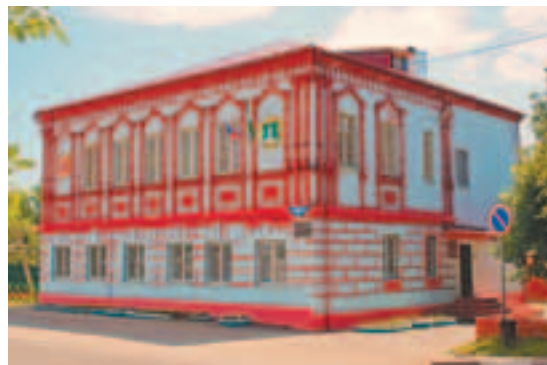
Здание администрации города

В этой части города расположен и частный сектор с уцелевшими