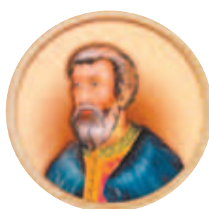
Великий князь Василий II Васильевич Тёмный (1415—1462) Годы правления: 1425—1446, 1447—1462

Все годы правления Василия на Руси свирепствовала моровая язва, очаги эпидемии которой вспыхивали то в одном княжестве, то в другом. Умер великий князь Василий Дмитриевич 27 февраля 1425 года в 53-летнем возрасте, будучи уважаем народом и неприятелями. Сыну его, Василию Васильевичу, всего всего 10 лет, поэтому в завещании великий князь оставил ему все свои владения и поручил правление супруге при участии тестя и брата.