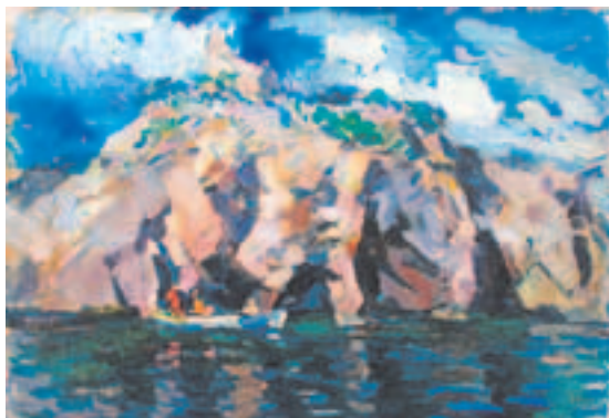
К. Коровин. Высокий берег. 1916 г.

Специальный раздел экспозиции посвящён работе мастера в монументальном искусстве. В 1894 году Коровин по инициативе предпринимателя и мецената С.И. Мамонтова совершил путешествие в северные губернии России и далее — в земли Норвегии, Швеции и Финляндии. Многочисленные пейзажные этюды, бытовые зарисовки, своего рода исследования уклада жизни северных народов и особенностей