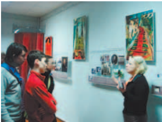
Знакомимся с творчеством Хайма Сутина