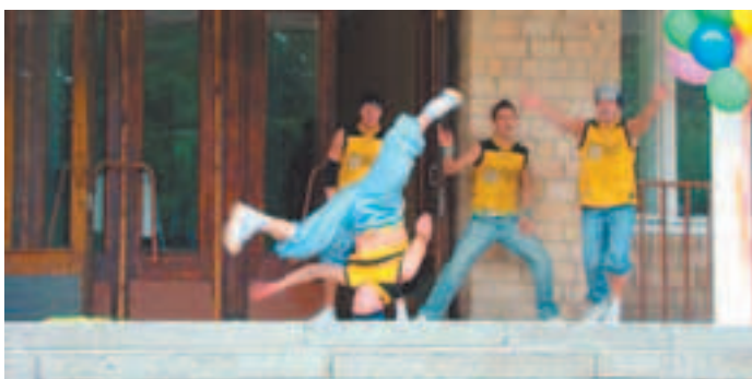
Молодость активна и красива, пусть такой и остаётся