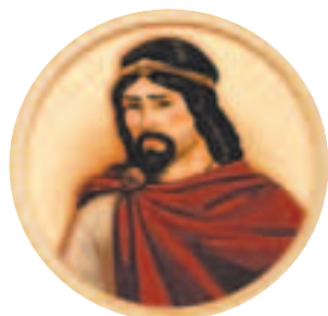
Великий князь Дмитрий Юрьевич Шемяка (1420–1453) Годы правления: 1446–1447

Юрий Дмитриевич умер 6 июня 1434 года. Титул московского государя сразу же принял сын Юрия Василий Косой, но его братья воспротивились этому и прогнали Косого, заключив мир с вернувшимся из изгнания Василием Дмитриевичем.