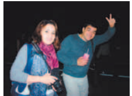
Отдыхать надо с умом!

Комиссия по делам несовершеннолетних и защите их прав также даёт согласие на переход детей из школы на другие