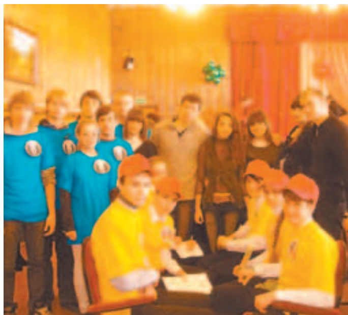
Команды Юбилейного и Червня

Большое спасибо всем организаторам этого замечательного путешествия!»