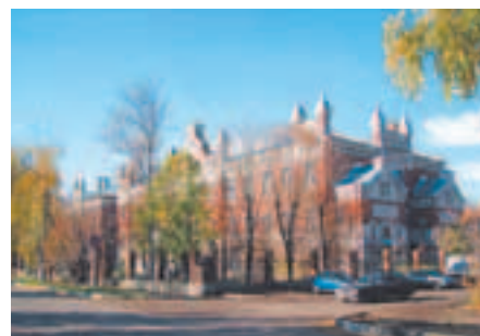
Главный корпус бывшего Механико-электрического училища

в ближнем располагается школа. А в главном теперь филиал знаменитого Станкина – Московского технологического института. От площади Александра Невского видны золотые купола «Георгиевской старообрядческой церкви». Довольно громоздкая и приземистая, она была перестроена из молельного дома.