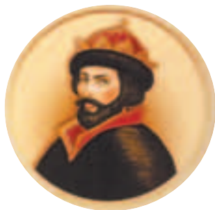
Великий князь Юрий Дмитриевич Звенигородский (1373–1434) Годы правления: 1433, 1434

Б рат умершего Василия Дмитриевича звенигородский князь Юрий Дмитриевич считал себя законным преемником великокняжеского престола. Узнав о принятии племянником титула великого князя, Юрий стал собирать в своём уделе войско.