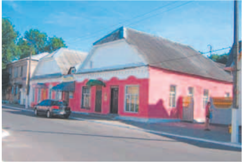
Историческая застройка г. Червеня