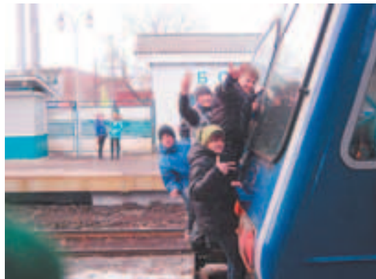
Зацеперы на станции Болшево

дости. Но есть одно НО: зацеперы гибнут страшно, нелепо и совсем не так героически, как написано в группах. Наше Ярославское направление МЖД, наряду с Горьковским, самое популярное для этого глупого занятия. В Юбилейном было составлено несколько протоколов и были смертельные случаи. А теперь убираем красочную упаковку и видим. Паренёк, решивший доказать всему миру, как он крут и бесстрашен и всего несколько минут назад планирующий свою жизнь, лежит на путях бездыханный...электричка продолжала путь, его друзья-зацеперы умчались дальше жить, даже его родители, безутешные в