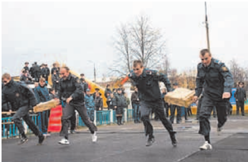
Один из этапов соревнований

Во Дворце культуры были организованы выставки фотографий и детских рисунков, отражающих деятельность сотрудников подмосковной полиции. А вечером состоялся большой концерт артистов эстрады. Во время праздника все участники могли отведать горячую кашу из полевой кух-