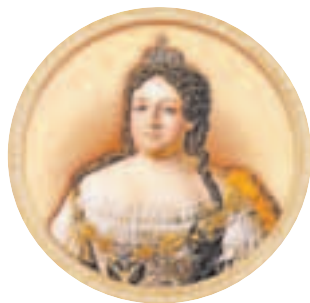
Императрица Анна Иоанновна (1693–1740)