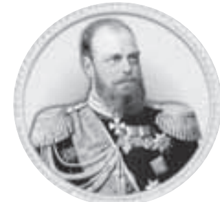
Император Александр III Александрович (1845–1894) Годы правления: 1881–1894

26 февраля 1881 года Александр Александрович Романов отменил своё 36-летие, а 2 марта он получил атрибуты царской власти. Народовольцы просчитались, и прогремевшие взрывы на Екатерининском мосту не стали сигналом к народному восстанию. Вместо убитого императора на трон взошёл следующий монарх.