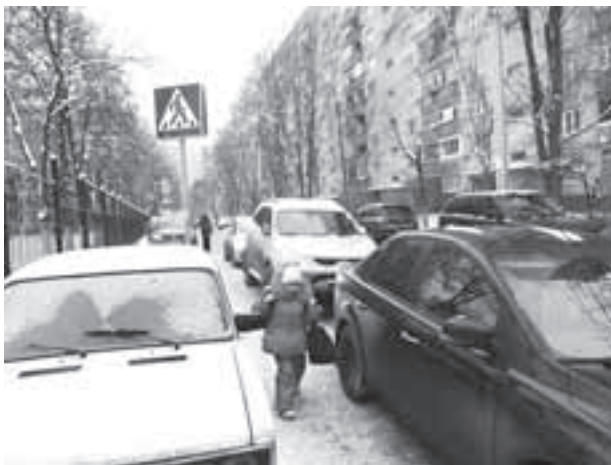
Девочка пытается пройти между «ВАЗ-2106» и иномаркой, припаркованными рядом, прямо напротив ворот гимназии № 5

Сразу после совещания я отправилась к зданию гимназии. Действитель-