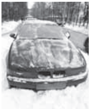
Автомобиль марки «BMW» в сугробе на проезжей части ул. А.И. Соколова, как раз напротив школьной калитки