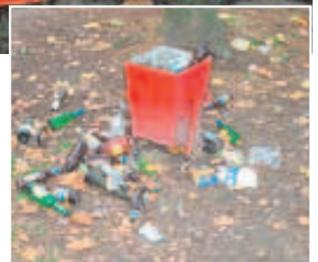
Пушкинская улица, детская площадка

Елена МОТОВА, фото автора, А. Суеваловой, А. Заборского