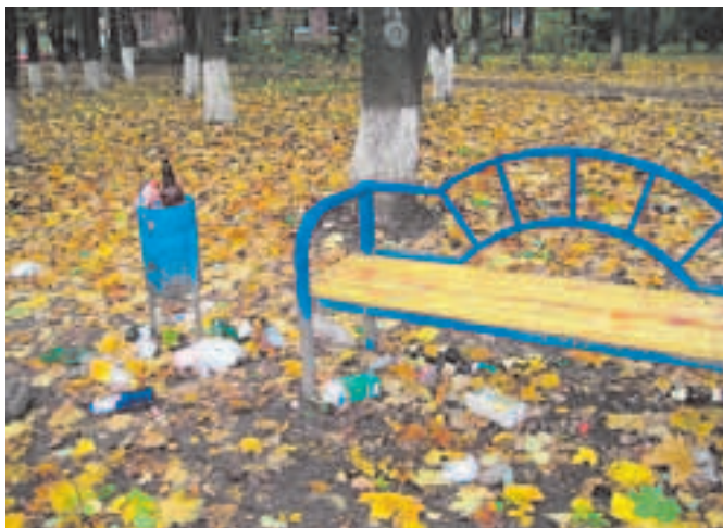
«Место отдыха» в сквере 2-го микрорайона

Связано ли это с техническими проблемами, нехваткой кадров или с тем, что контракт по благоустройству с МУП «ЖКО» был заключён на 9 месяцев (о чём со-