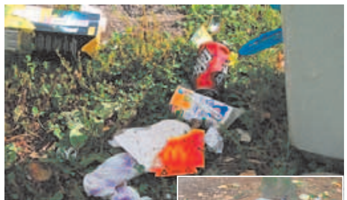
Ул. Б. Комитетская. Макдоналдса в нашем городе ещё нет, а мусор уже есть...