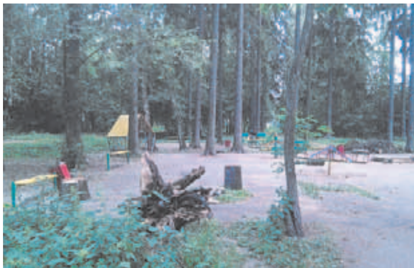
Двор домов № 7, 9 по ул. Пушкинской. Всё лето здесь лежали спиленные ветки и выкорчеванные пни

безопасных площадках). Ещё есть у нас во дворе качели-карусели, установленные в год постройки наших домов (1994) и уже ставшие опасными, песочница, в которой почти нет песка, а больше мусора и окурков. Асфальт, на котором стоит вся наша «современная» площадка, весь в ямах, трещинах и буграх, отчего малыши постоянно спотыкаются и падают уже на описанную выше