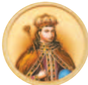
Правительница царевна Софья Алексеевна (1657–1704) Годы правления: 1682–1696

Сохранилось словесное описание Ивана одним из его современников: «В 27 лет он выглядел совсем дряхлым, плохо видел и, по свидетельству одного иностранца, был поражен параличом. Безучастно, мертвенной статуей на своём серебряном кресле под образами сидел царь Иван в мономатовой шапке, нахлупнутой на самые глаза, опущенные вниз и ни на кого не глядевшие». Иван V неожиданно скончался в 1696 году, ему было всего 30 лет.