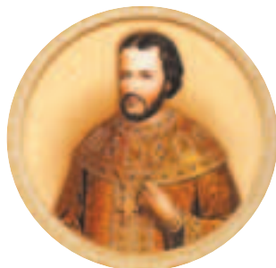
Царь Иван V Алексеевич (1666–1696) Годы правления: 1682–1696

В час кончины Фёдора Алексеевича бояре во главе с патриархом Иоакимом провозгласили государем 10-летнего царевича Петра. Боярам не хотелось возвращения к власти Милославских, что предполагало бы царствование Ивана Алексеевича.