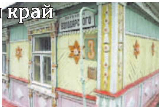
Традиционные русские дома в Рузе

С 1784 года Руза застраивалась бревенчатыми домами. Кирпичное строительство началось с 1960-х годов в основном в центре и на левобережье, так что в заречной части города и сейчас стоит деревянная самобытная Руза. В Рузском районе до сих пор красуются усадьбы ансамбли конца XVII—XIX веков: Архангельское, Знаменское Аннино, которое было вотчиной бояр Милославских; Богородское, Васильевское — родовое имение А.И. Герцена, Волинщино, с 1770-х годов принадлежавшее князю