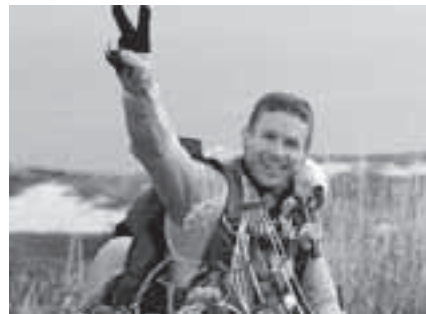
Ф. Баумгартнер после приземления

За Феликсом Баумгартнером теперь закреплены рекорды скорости свободного падения, высоты полёта на воздушном шаре и высоты прыжка. Высотный держался почти полвека. Его установил майор советских ВВС