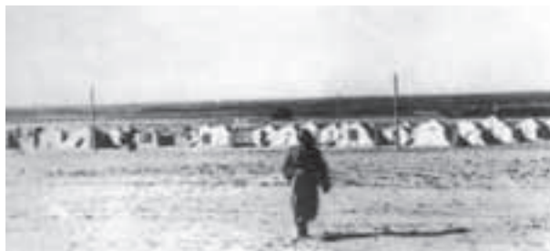
Рождение полигона на излучине реки Сырдарья в 1955 году