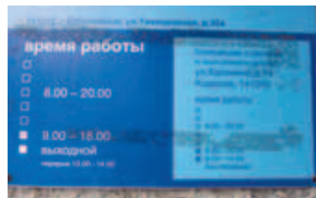
График работы на вывеске почтового отделения может ввести горожан в заблуждение

Страницу подготовила Наталья ПОДОЛЬСКАЯ