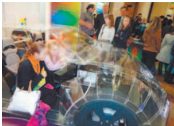
В автомобиле будущего

Большой адронный коллайдер – многие взрослые (конечно, далёкие от науки) всерьёз