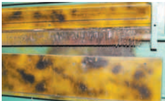
Уже горевший и вновь готовый к очередному возгоранию радиатор центрального отопления во втором подъезде дома № 14 по ул. Большой Комитетской.

О созданном здесь интерьере лестничной курилки заговорили на одном из совещаний у Главы города. А я, получив задание запечатлеть плоды «рукоделия» курящих