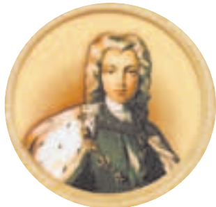
Император Пётр II Алексеевич (1715–1730)