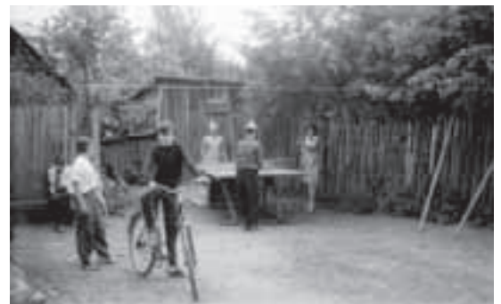
Во дворе «Мадрида», 1964 г.