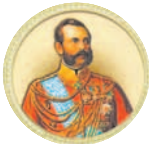
Император Александр II Николаевич Осободитель (1818–1881)