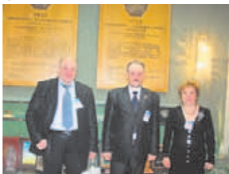
Делегация г. Юбилейного на Форуме в Минске

В основном города-побратимы России и Беларуси сотрудничают в области культуры, спорта, молодёжного движения. Но основное внимание на встрече было уделено развитию экономических связей, которые необходимо активно развивать. Рассматривались вопросы сотрудничества в промышленности, строительстве, сельском хозяйстве, налаживания товарооборота. Все пленарные заседания проходили в конструктивной обстановке. Подчёркивалось, что особое внимание необходимо уделять созданию совместных предприятий и проектов.