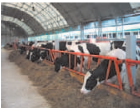
На ферме Червенского агрокомбината

Доеение происходит в доильном зале на 50 голов. Управление доильным оборудованием полностью компьютеризировано и позволяет осуществлять: учёт ежедневных надоев, автоматический съём и промывку доильного аппарата, разделение молока по сортам, индивидуальный адресный докорм концентратами во время доения для повышения молокоотдачи и продуктивности животных, щадящее доение для сохранения здоровья вымени коров. Работа оператора в доильном зале заключается в том, чтобы по очереди каждой корове