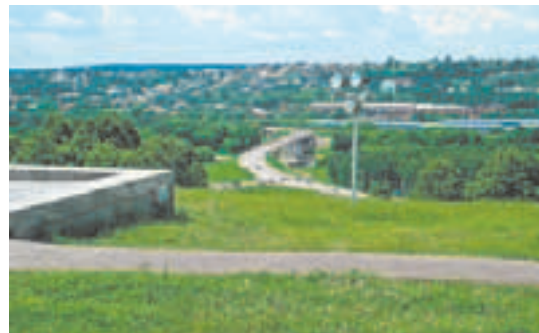
Вид на Яхрому с Перемиловской высоты

Современная Яхрома известна своими горнолыжными курортами. Здесь также находится филиал Волжского авто-