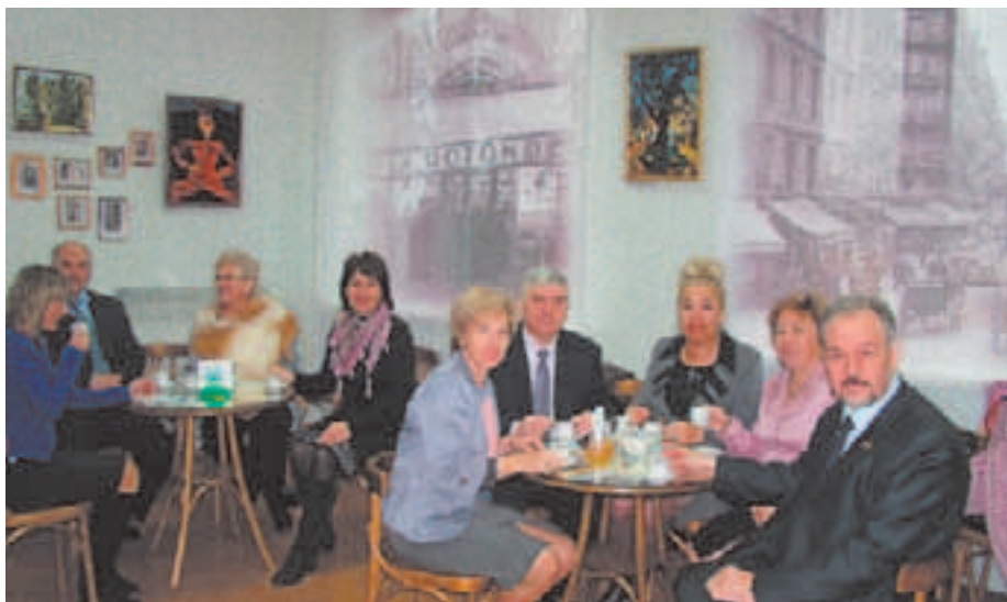
В «Парижском кафе» — в музее Хайма Сутина

Город Юбилейный на протяжении 6 лет поддерживает и развивает дружеские добрососедские отношения с белорусским городом Червень Минской области. Поэтому, приехав в Минск на государственное мероприятие, наша делегация посетила и Червенский район, где была приглашена на празднование Дня работников сельского хозяйства. Не первый раз проходят такие поездки — и всегда это самые тёплые встречи, улыбки, новые открытия.