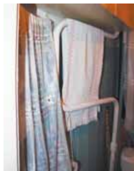
Полотенцесушитель в ванных комнатах дома имеет своеобразный вид

Остаётся пожелать, чтобы стояк, наконец-то, нагрелся до нормальной температуры и сохранял её в любое время суток, ведь тепло – незаменимо!