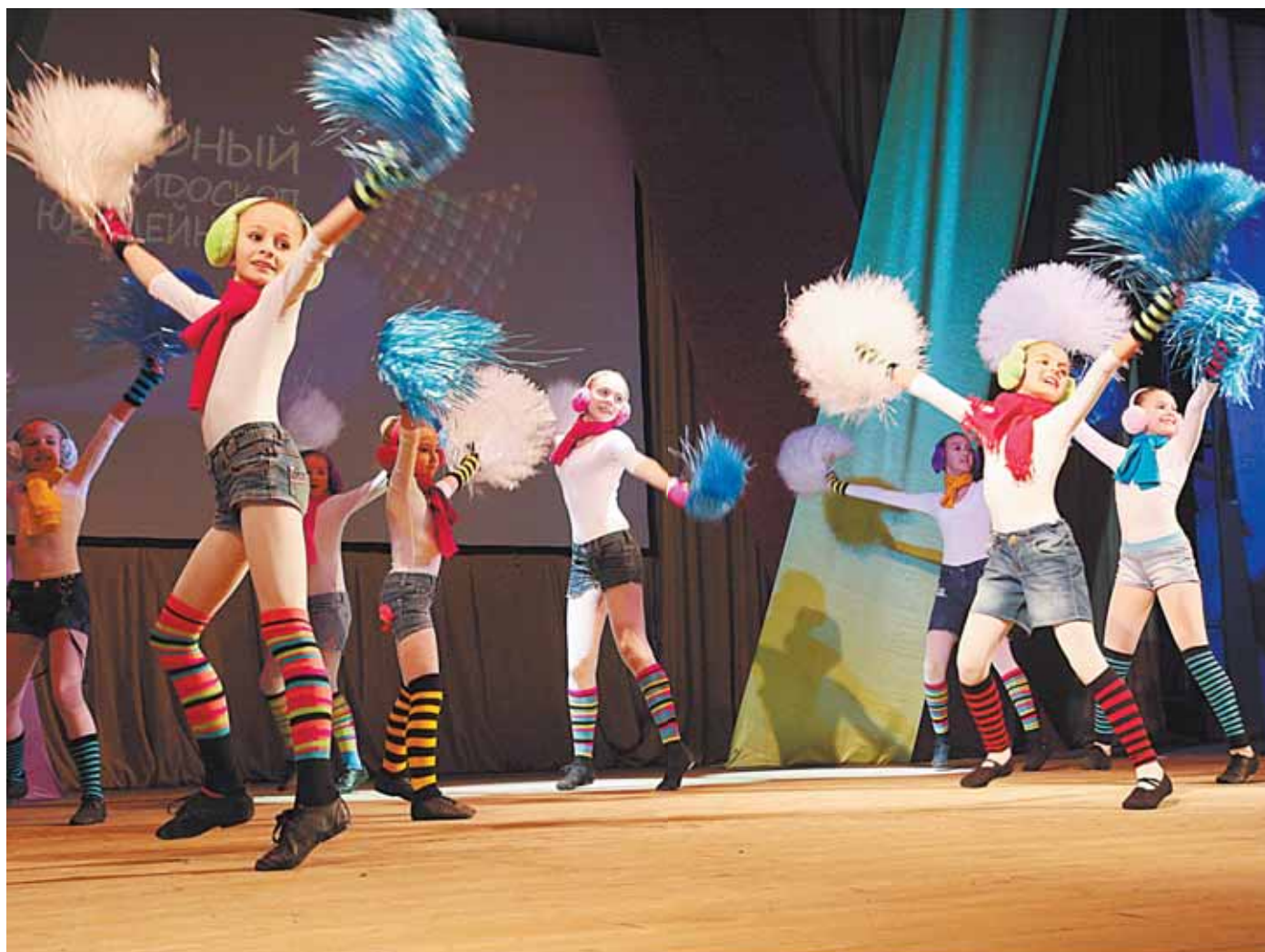
Торжественное закрытие городского фестиваля «Звёздный калейдоскоп Юбилейного» прошло в пятницу 21 декабря. Читайте материал в следующем номере.