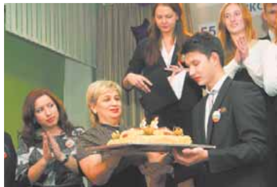
Юбилейный торт для всей школы

Много было приветствий, наградений, подарков и пожеланий... Коллеги, друзья, родители... Но этих слов может