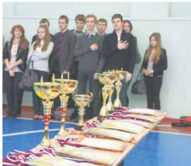
Страницу подготовила Елена МОТОРОВА

Кто говорит, что подарки приносит Дед Мороз – новогоднее настроение создаётся «собственными руками» – отличными результатами. Так держать, лицеисты!