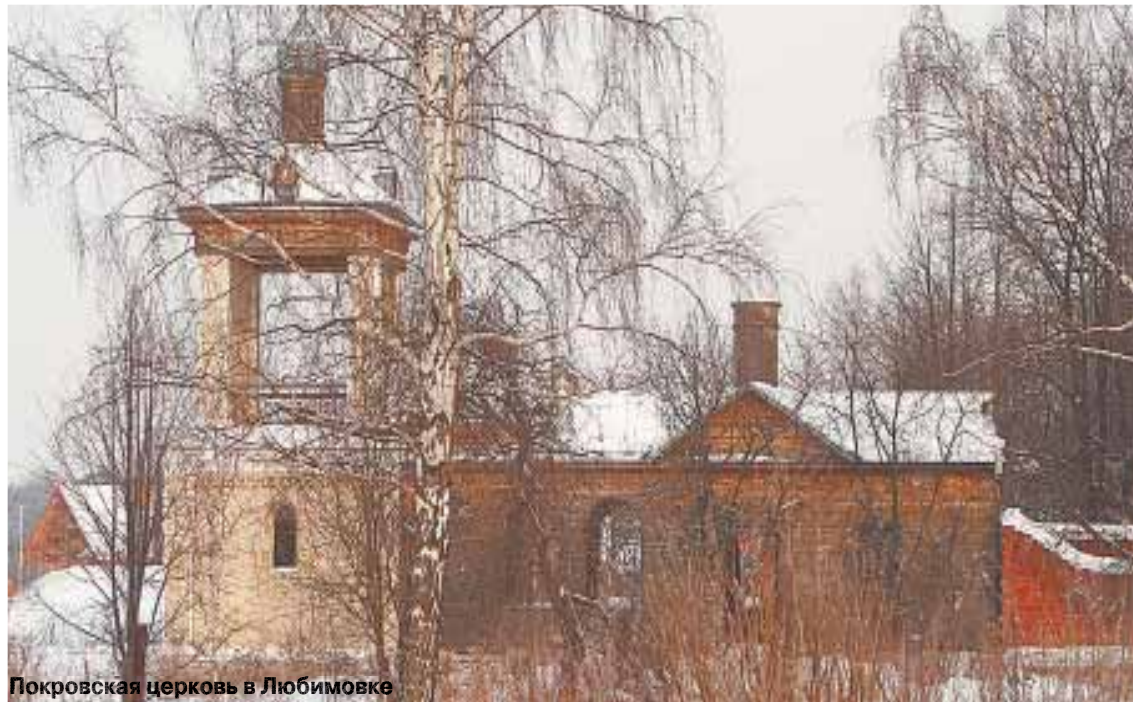
Покровская церковь в Любимовке

поставлены многие пьесы, а Константином сыграны многие роли. «Простой павильон или деревянные кулисы — вот и