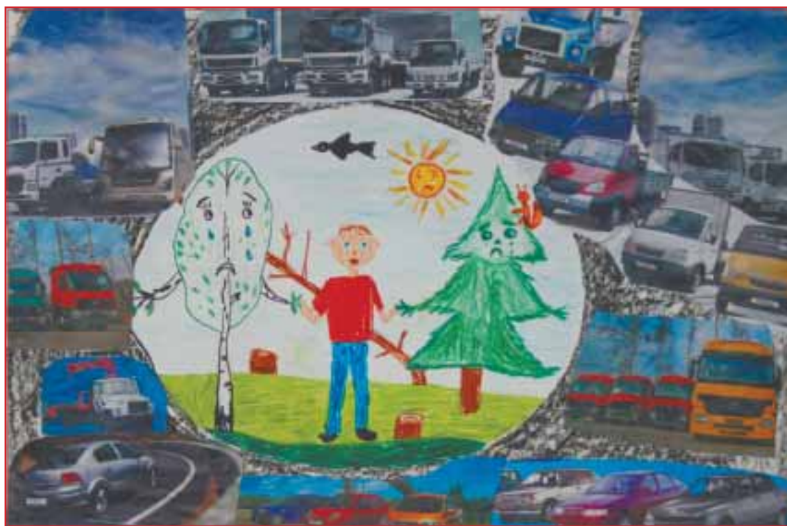
«Спасите нас от машин» – плакат Алексея Островского