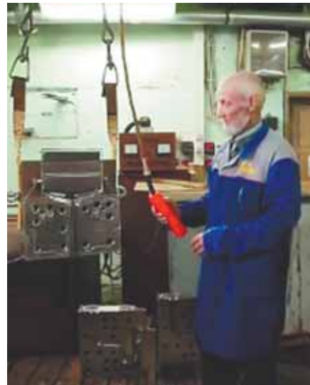
В цеху ООО «РАМ» процедура снятия американского износостойкого хрома и нанесение отечественного нанохрома на американскую фильеру для станка-экструдера

Сейчас у нас находится делегация из Финляндии, прорабатывая вопрос аренды помещения. Город Юбилейный может стать плацдармом для проведения маркетинговых исследований на территории Российской Федерации, и в первую очередь, в близком Подмосковье. Благоприятный момент связан ещё и с тем, что в Совет депутатов города вошли энергичные депутаты, которые знают проблемы Юбилейного и активно поддерживают вопросы поиска и привлечения в наш город инвестиций.