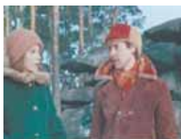
«АЛЁША» Подмосковье, Понедельник, 11 февраля, 09.50