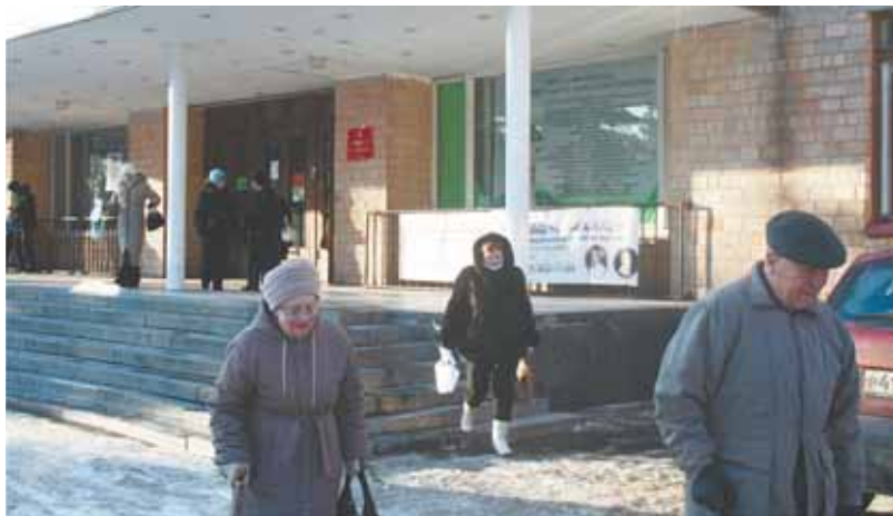
Здание Гарнизонного дома офицеров передано в муниципальную собственность, но без земли!

Как известно, сегодня во многих муниципальных образованиях остро стоит вопрос передачи объектов социальной инфраструктуры и жилищно-коммунального хозяйства от Минобороны в муниципальную собственность. С этой проблемой столкнулся и городской округ Юбилейный.