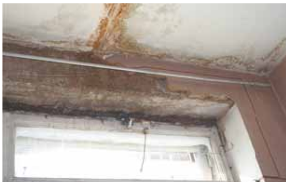
В таком помещении хранятся книги...

В помещении стоит постоянная сырость и холод, отчего книги приходят в непригодное состояние. В норме