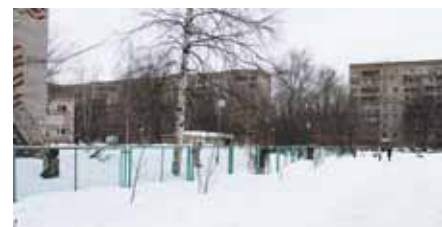
На улице Лесной будет новый детский сад

12 марта депутаты городского Совета на внеочередном заседании приняли изменения в бюджет города: 76 миллионов рублей поступило из области на строительство в Юбилейном нового детского сада. Сотрудниками Управления архитектуры и строительства Администрации выдано разрешение на возведение этого социального объекта. Расчётный срок строительства — с 15 марта по 1 октября 2013 года. Далее последует период ввода в эксплуатацию. С представителями ООО «Технострой» проведено совещание по вопросу расширения площадки под строительство. Для наблюдения за ходом работ установлено веб-камера.