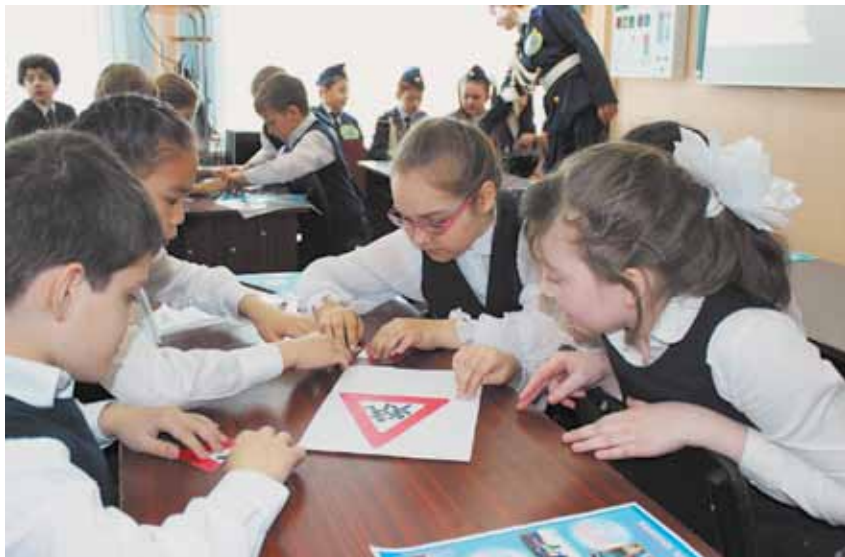
В игре «Я – пешеход» требовалось собрать из фрагментов дорожный знак и объяснить его назначение. На фото – команда-победитель

Гостей познакомили с одним из лучших в области обучающим велогородком, оборудованном в школьном дворе; пригласили на открытый урок, проведённый для учащихся