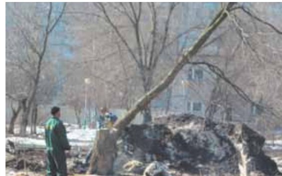
Именно под этим деревом проходил кабель, повреждённый при выкорчёвывании пня

Специалисты Управления архитектуры и строительства выдали Генподрядчику, ведущему строительство детского сада, предписания на устранение недостатков в организации строительной площадки и в проведении работ: выявлены несоответствия СНиПам.