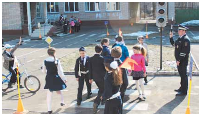
Занятия в велогородке гимназии № 5

В городах Королёве и Юбилейном в этом году участниками ДТП стали двое детей. За тот же период прошлого года пострадали четверо.