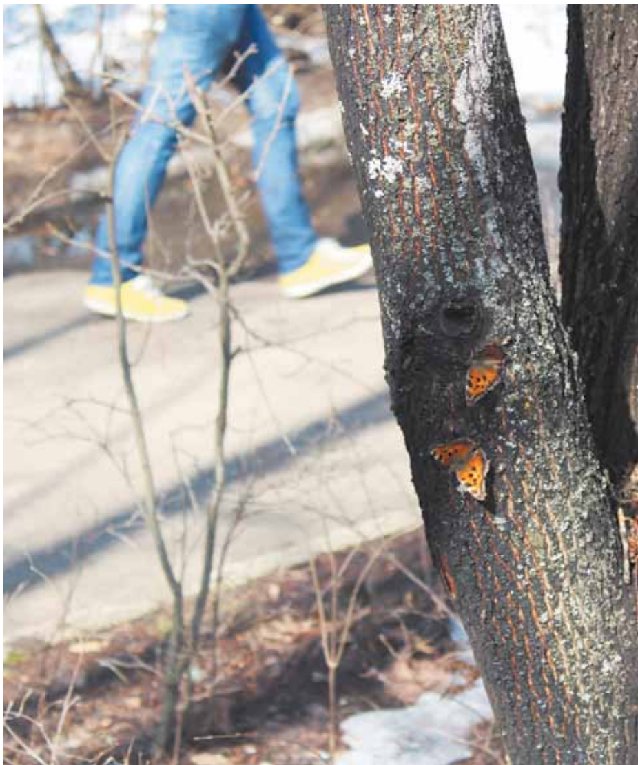
На дружеской пирушке...