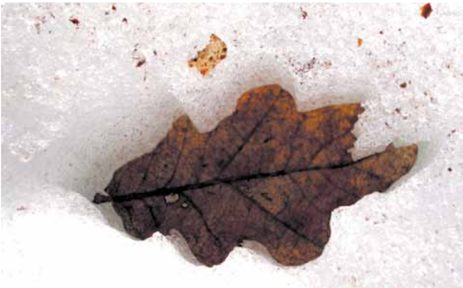
Только лето не позвали!