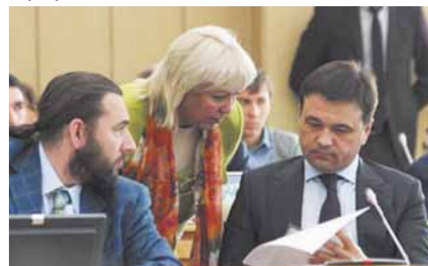
Рабочий момент экологической конференции

Андрей Воробьёв выступил с предложением принять программу по масштабной высадке деревьев: «Я считаю, что в Московской области мы должны высадить как минимум семь миллионов деревьев, нам ни-