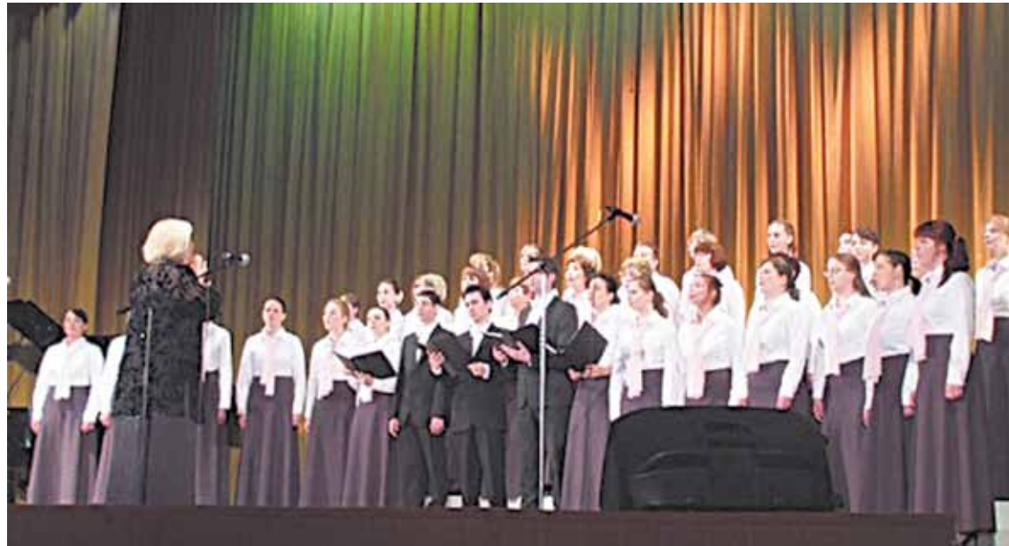
Победитель конкурса — хор лицея № 4

В конце все участники снова поднялись на сцену, чтобы исполнить вместе финальную песню «Учительский вальс». Вышло просто потрясающе! На одной сцене одновременно находились двести поющих сер-