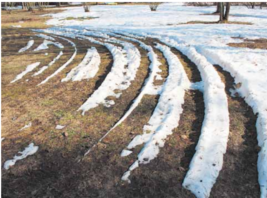
Тает снег и улыбается