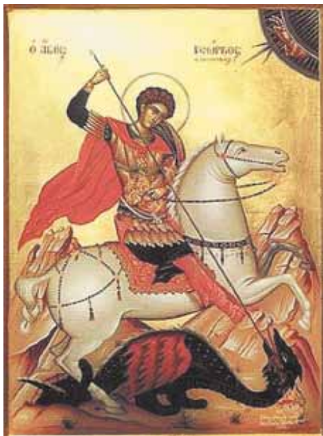
Св. великомученик Георгий Победоносец

Великомученик Георгий вырос в христианской семье. Поступив на воинскую службу, он проявил ум и отвагу, его ценили за отличную выправку и физическую силу. Вскоре Георгий достиг звания тысяченачальника и стал любимцем императора Диоклетиана. Но это были времена гонений на Церковь Христову. Раздав своё имущество бедным, Георгий явился к Диоклетиану и объявил себя христианином. Император пытался уговорить его отречься от Христа, но воин был твёрд. Тогда Георгия подвергли страшным пыткам. Но святой переносил истязания с непреклонной стойкостью и мужеством. В конце концов Диоклетиан приказал зарубить мученика мечом.