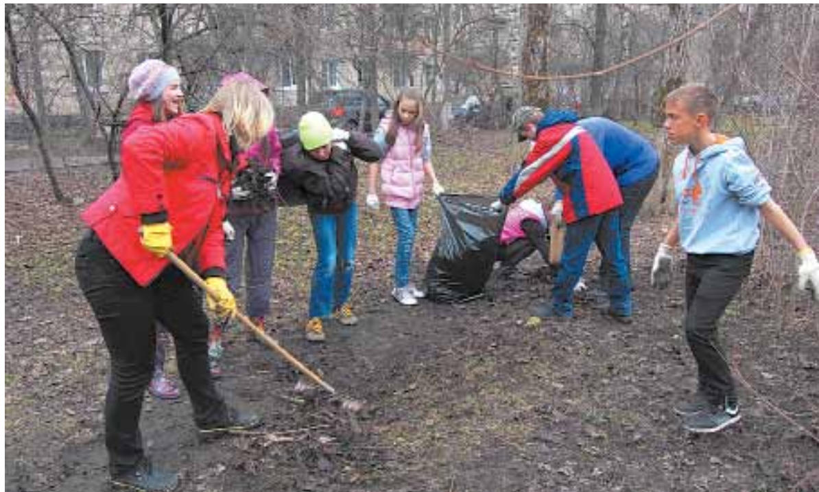
Пятиклассники и учителя школы № 2 внесли свой весомый вклад в уборку города. Молодцы!

27 апреля прошёл городской субботник. После первых дождей, умывших город, люди вышли на улицы, чтобы сделать их ещё чище. А в Комитетском лесу в этот день на месте вырубленных елей высаживали дубки, выращенные зимой на подоконниках. В добрый час!