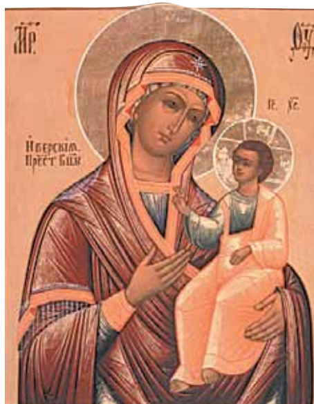
Иверская икона Божией Матери

Образ Божией Матери Вратарница — одна из самых чтимых православных святынь. Название икона получила по месту пребывания в Иверском монастыре на Афоне, где она ранее помещалась над главными вратами. 25 октября 1995 г. с Афона в Москву прибыл новый список чудотворной иконы.