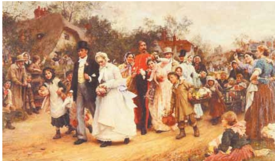
Свадьба на Красную горку

«Кто на Красной горке женится, тот век не разведется», — считается в народе. Свадьба на Красную горку обещает благополучие и счастье новоиспечённой семье.