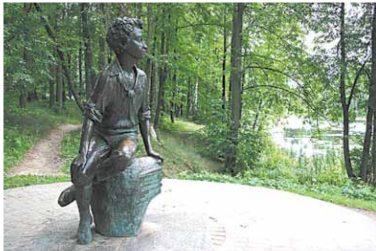
Памятник юному Пушкину в селе Захарове

до Захарова можно следующим образом: выезд из Москвы с Белорусского вокзала. Проезд до платформы Голицыно и далее автобусом или маршрутным такси до остановки «Захарово». Или с Белорусского вокзала до платформы Захарово на поездах, следующих по ветке на Звенигород. Далее от платформы Захарово до музея можно дойти пешком. Режим работы музея с 10.00 до