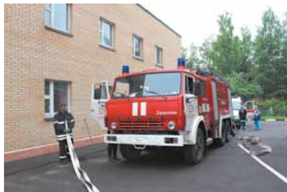
В объектовой тренировке принял участие пожарный расчёт ПЧ № 329

После поступления сигнала на пульт диспетчера, пожарные прибыли через 6 минут, сотрудники отдела полиции – через 7, а машина скорой помощи – через 2 минуты.