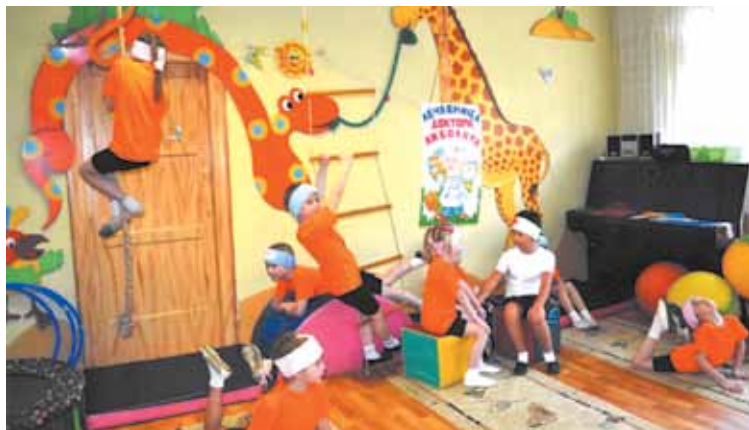
«Доктор Айболит» в исполнении воспитанников детского сада № 37 «Рябинка»