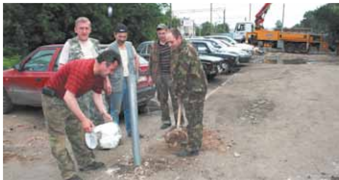
Слесари ЖЭУ-2 приступили к работе по установке ограждения территории

— У нас есть некоторые подвижки. Одна из них — реорганизация работы дворников. При ЖЭУ № 2 и № 3 введены специальные должности — старший техник и техник. Они работают исключительно с бригадами дворников: ставят перед ними задачи (утром и вечером) и контролируют качество выполнения работ. Горожане уже заметили первые позитивные результаты такого подхода.