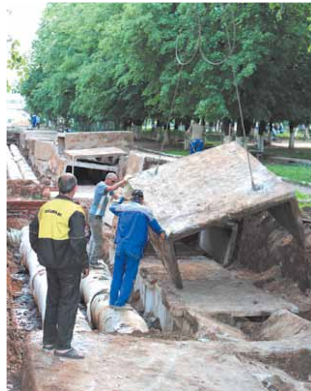
Замена трубопроводов на одном из наиболее аварийных участков города: в сквере 3-го микрорайона