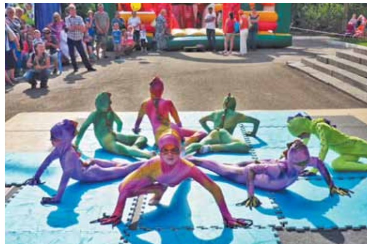
Цирковая студия представила... ящериц!

Из художников легко превращались в зрителей и от души аплодировали своим ровесникам, уже умеющим петь, тан-