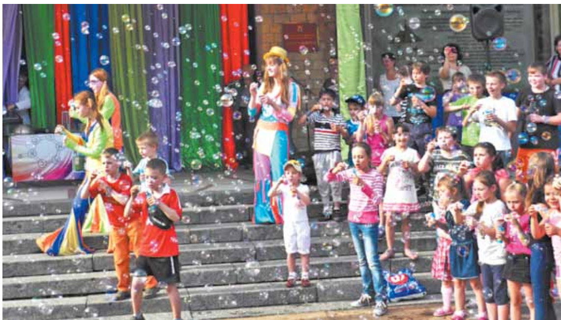
Салют из мыльных пузырей

В День защиты детей невидимые звёзды сошлись наилучшим образом: погода была по-настоящему летней, аниматоры и ведущие праздника – заводными, юные артисты блистали талантами.