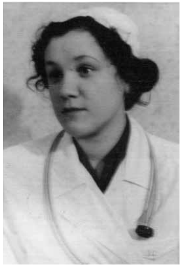
Студентка ЛМПИ. 1955 г.

Врач — лицо, получившее высшее медицинское образование по соответствующей специальности. Практикующий врач занимается предотвращением, распознаванием и лечением заболеваний и травм. Это достигается путём постоянного совершенствования познаний и мастерства. Успешное лечение в большой степени является искусством.