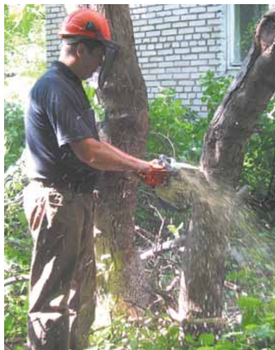
Работник МУП «ЖКО» выполняет заявку жильцов дома № 2/9 по ул. Большой Комитетской

Начиная с апреля в отдел ЖКХ, транспорта, связи и окружающей среды поступило 12 заявлений от горожан с просьбой спилить деревья: сухие, аварийно-опасные, а также те, что особенно сильно затеняют свет в квартирах. Такие работы проводятся согласно решению специальной комиссии. Пик их пришёлся на апрель, май, но и в июне такие работы ведутся достаточно интенсивно. Так, на прошлой неделе обрезка и спил деревьев проводились на улицах Лесной и Большой Комитетской. Только за два дня было спилено пять больших деревьев.