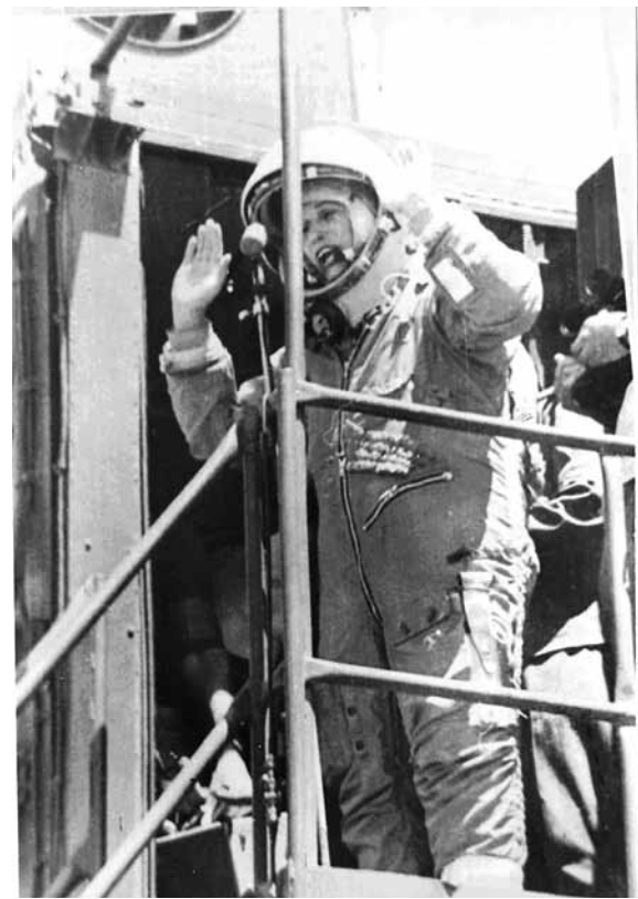
В.В. Терешкова у кабины лифта перед посадкой в корабль. Байконур 16 июня 1963 года

С нетерпением ждём по радио сообщение ТАСС. В нём, в частности, говорилось: «16 июня 1963 года в 12 часов 30 минут на орбиту спутника Земли выведен космический корабль «Восток-6», впервые в мире пилотируемой женщиной — гражданкой Советского Союза космонавтом Валентиной Владимиров-