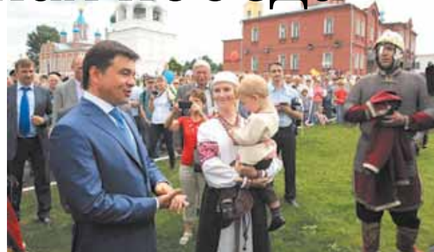
Андрей Воробьёв на Дне города в Коломне

Андрей Воробьёв сообщил, что действия областного правительства по реформированию Московской области находят поддержку на самом высоком уровне – у Президента Российской Федерации. Это, по мнению