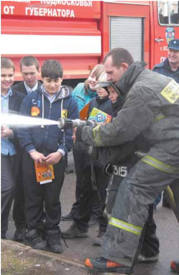
Профессионалы готовы прийти на помощь

В рамках мероприятий, посвящённых Дню Победы, 9 Мая в городском парке у фонтана состоялся первый в этом году концерт духового оркестра.