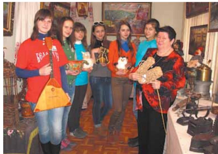
Делегация г. Червеня посетила Историко-художественный музей г. Юбилейного