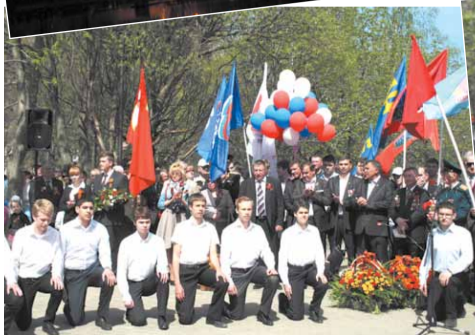
«Быть достойными вас, клянёмся!..»