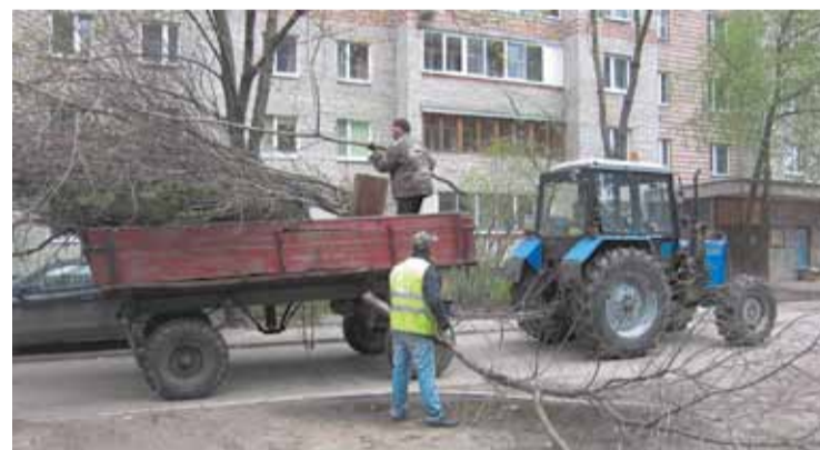
Работники МУП «ЖКО» вывезли этой весной около 150 кубометров обрезанных веток

В сквере третьего микрорайона сотрудники МУП «ЖКО» покрасили скамейки, урны, металлические ограждения. Запущен так любимый горожанами фонтан. Возле него теперь появилась клумба с цветами.