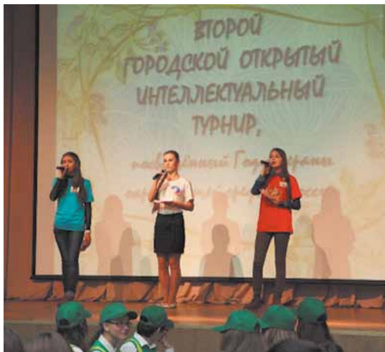
Девочки городов Юбилейного и Червеня исполняют песню о Белоруссии