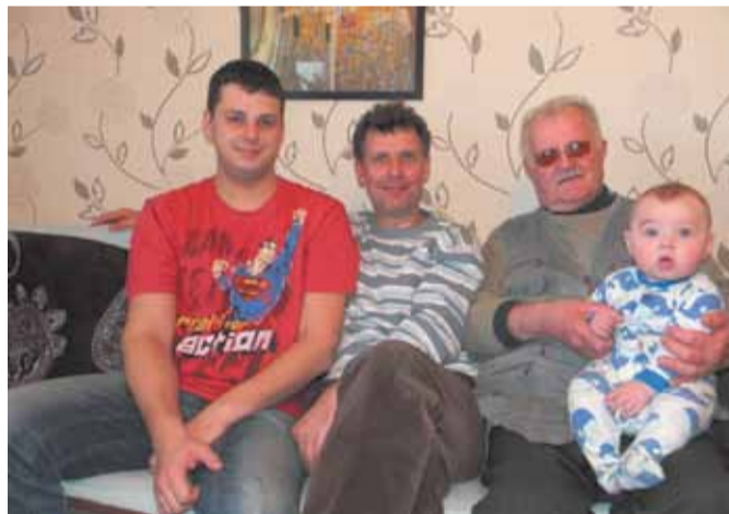
Четыре поколения семьи Вознюк