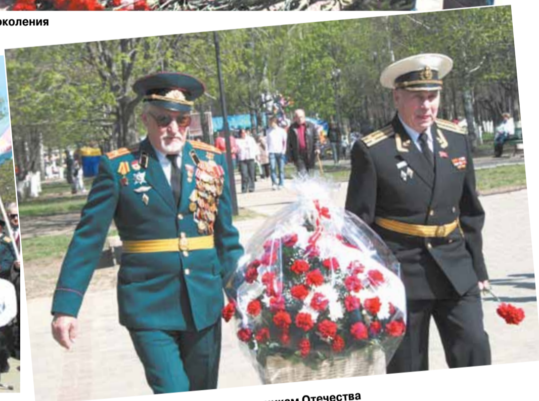
Возложение цветов к памятнику Защитникам Отечества