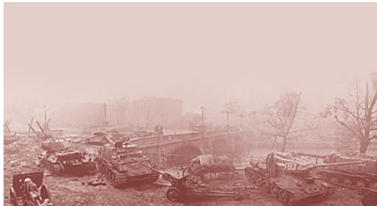
Форсирование р. Шпрее

Этот марш с местными боями длился трое суток, днём и ночью. Стояла задача спасти Прагу, в которой началось восстание, и чехи открытым текстом просили о помощи. В этом марше участвовали свыше 1600 танков и самоходных орудий, при полном превосходстве авиации. Передовые танковые батальоны вошли в Прагу в 3 часа утра 9 мая 1945 года. Немецкие воинские части пытались уйти на запад к американцам. Сопровождаемый батальоном танковый корпус вошёл в Прагу в 9 часов