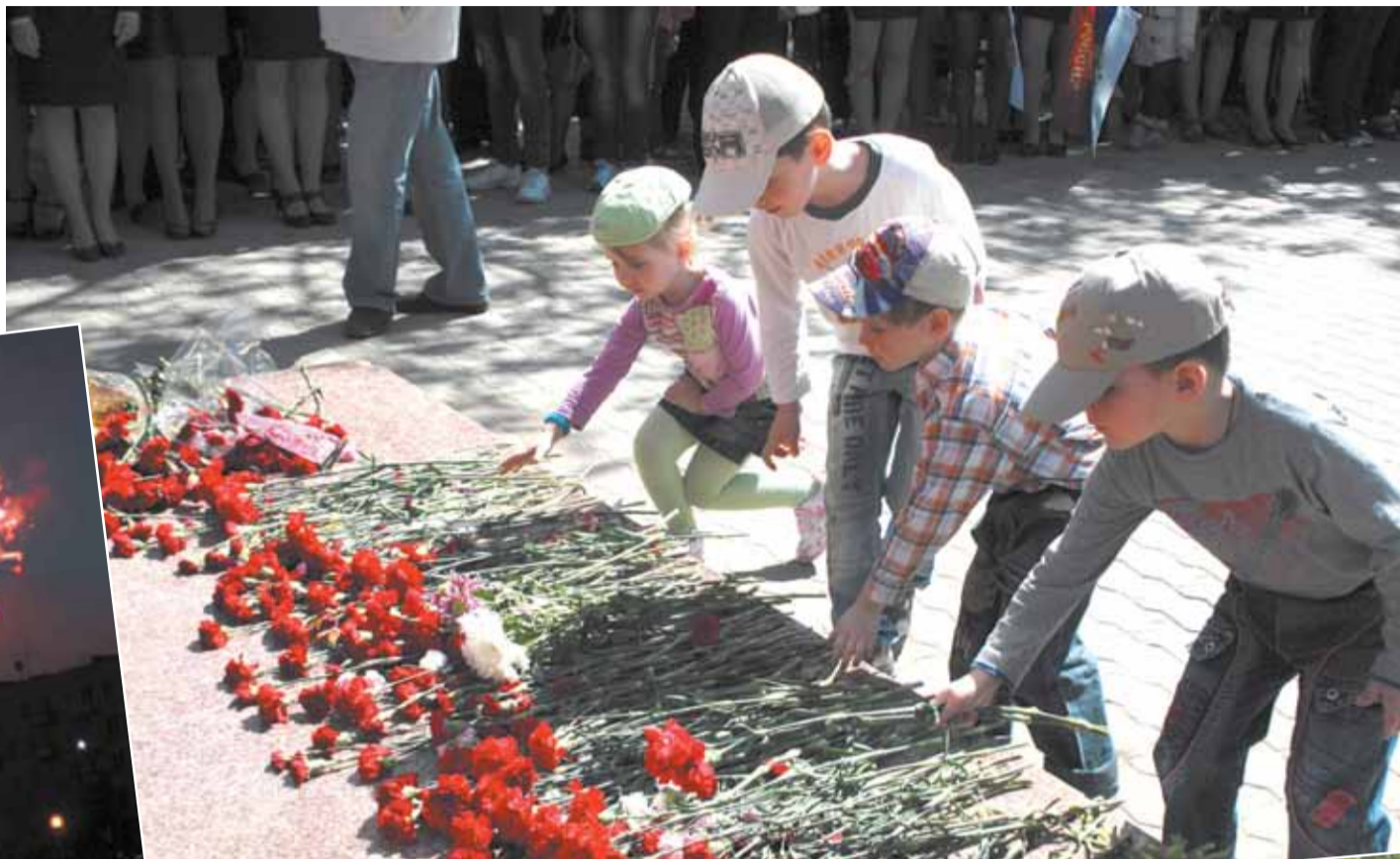
Благодарность через поколения

Долгих лет вам, дорогие ветераны, и пусть лица ваши будут всегда такими же светлыми, как в этот день — День Победы!