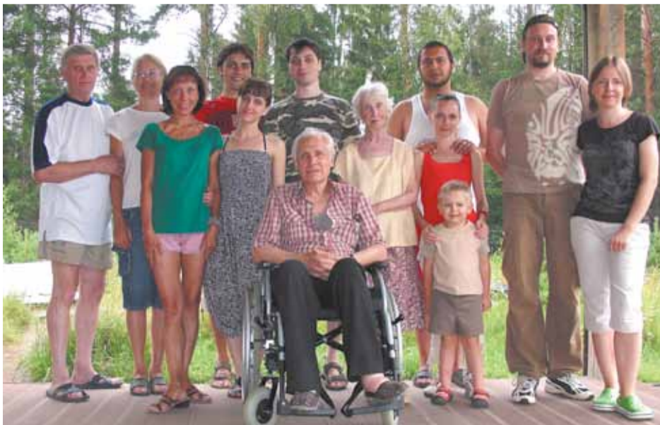
Дружная семья Прудковских. Родоначалники в окружении детей, внуков и правнука