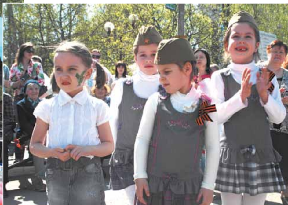
Спасибо за мирное небо!