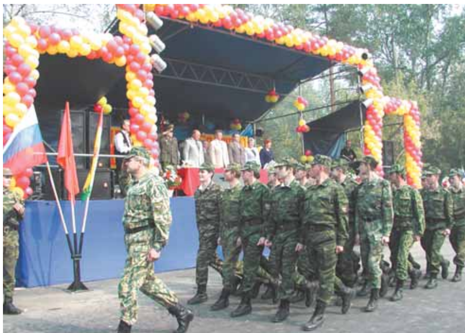
Десятилетний юбилей города. 2002 г.