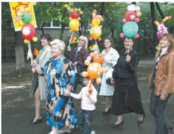
С коллегами на Дне города

Все эти годы «Теремок» является экспериментальной площадкой для самых передовых методик, современных педагогических технологий и научных изысканий. И каждый раз – успех, награды самого высокого уровня. Вся жизнь только на «отлично»!