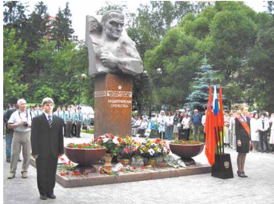
У памятника «Защитникам Отечества». 9 Мая 2009 г.

жило. Люди работали дружно, весело, с удовольствием. Включали динамик. Время было бескорыстное, хотелось принимать участие в массовых мероприятиях. Сейчас молодежи этого не понять. А нам было здорово! Закончили посадку в год Олимпиады. Вообще, сквер стал символом эволюции жизни нашего города — нашим «Гайд-парком» — традиционным местом политических митингов, празднеств и гуляний.