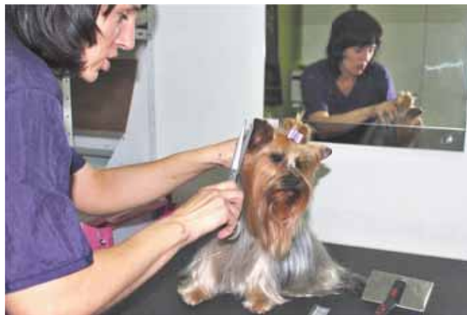
Разговор с клиентом

— Со многими собаками мы общаемся еженедельно уже на протяжении нескольких лет. Конечно, они относятся ко мне как хорошей знакомой и не проявляют агрессии. И я уже чувствую их настроение, так что мы отлично ладим. Некоторые, наоборот, бывают напуганы разлукой с хозяйкой, и их нужно утешить, подбодрить. Если человек не умеет находить общий язык с животным, то ни желание заработать, ни интерес к модной профессии не помогут ему остаться в ней. У меня с детства жили дома собаки, в основном, охотни-