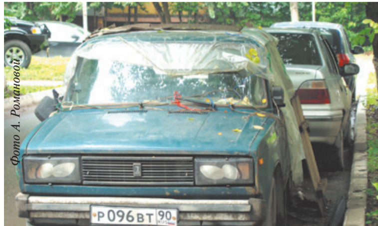
На улице Глинкина