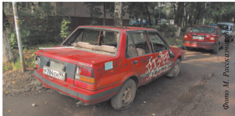
Автомобиль, стоящий на углу ул. Нестеренко и Папанина

Всё новые и новые адреса брошенных машин сообщают нам читатели газеты. Малая Комитетская, Глинкина, Маяковского... Найдётся ли хоть одна улица в городе, где нет этой проблемы? Жители обращают внимание на то, что неплохо было бы очистить дворы и улицы перед Днём города.