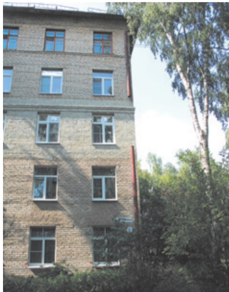
а спилили здесь