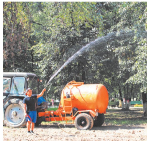
Чтобы газонная трава в сквере взошла быстрее

Компания «Телероман» снимает в нашем городе очередную серию телесериала «След». 16 августа киносъёмочная группа работала на площади перед Административным зданием г. Юбилейного. Режиссёр снимаемого детектива – известный актёр Михаил Богдасаров. Это вторая его режиссёрская работа. Выход киноленты на экран планируется в октябре–ноябре.