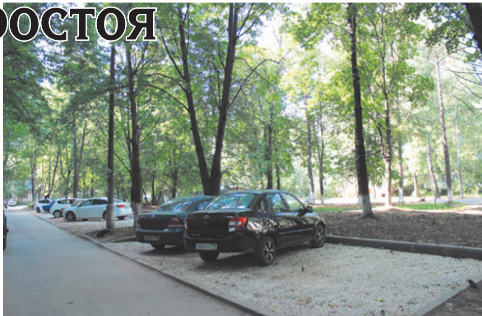
У дома № 6 на ул. Лесной приступили к оборудованию парковочных «карманов»

Пользуясь случаем, мы обратились к Юлию Донардовичу с самыми «горячими» вопросами, поступившими к нам в редакцию от горожан, и порадовались оперативному решению одного из них.