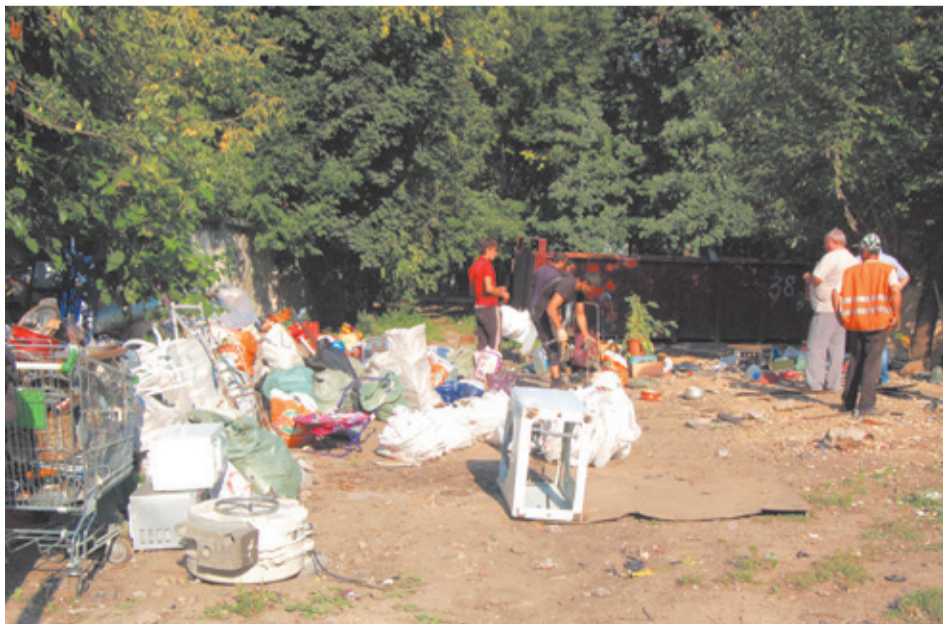
Сотрудники МУП «ЖКО» ликвидирует свалку